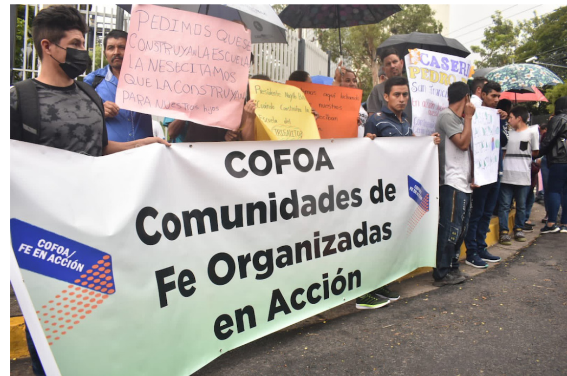
COFOA se presenta en la Asamblea Legislativa para pedir legislación sobre temas que le atañen o afectan a la población más vulnerable.