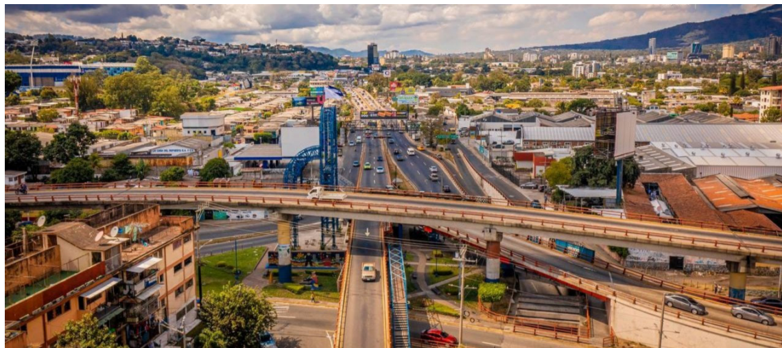
La Comisión de Hacienda de la Asamblea Legislativa ratificará un préstamo para financiar programas de infraestructura vial.

El cuarto eje es enfocado en obras hidráulicas en el bulevar de Los Próceres y la 49 avenida Sur, donde se construirá un nuevo colector de aguas lluvias para aumentar la capacidad de drenaje y reducir las inundaciones, ya que el sistema actual resulta insuficiente frente al cre-