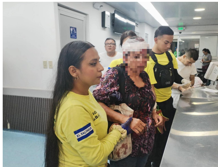
La mujer sufrió lesiones en la cabeza y el rostro. Socorristas de Comandos de Salvamento la auxiliaron.