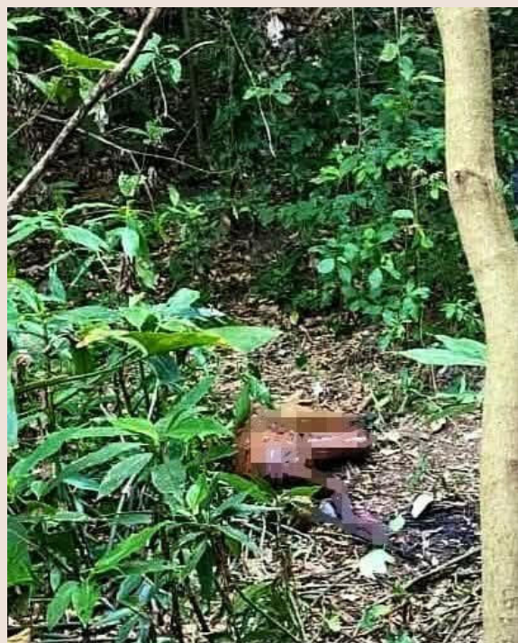
Residentes del sector alertaron a las autoridades tras percibir un fuerte mal olor.

Hasta el momento, las autoridades no han brindado detalles sobre la identidad de la víctima ni sobre las causas de la muerte.