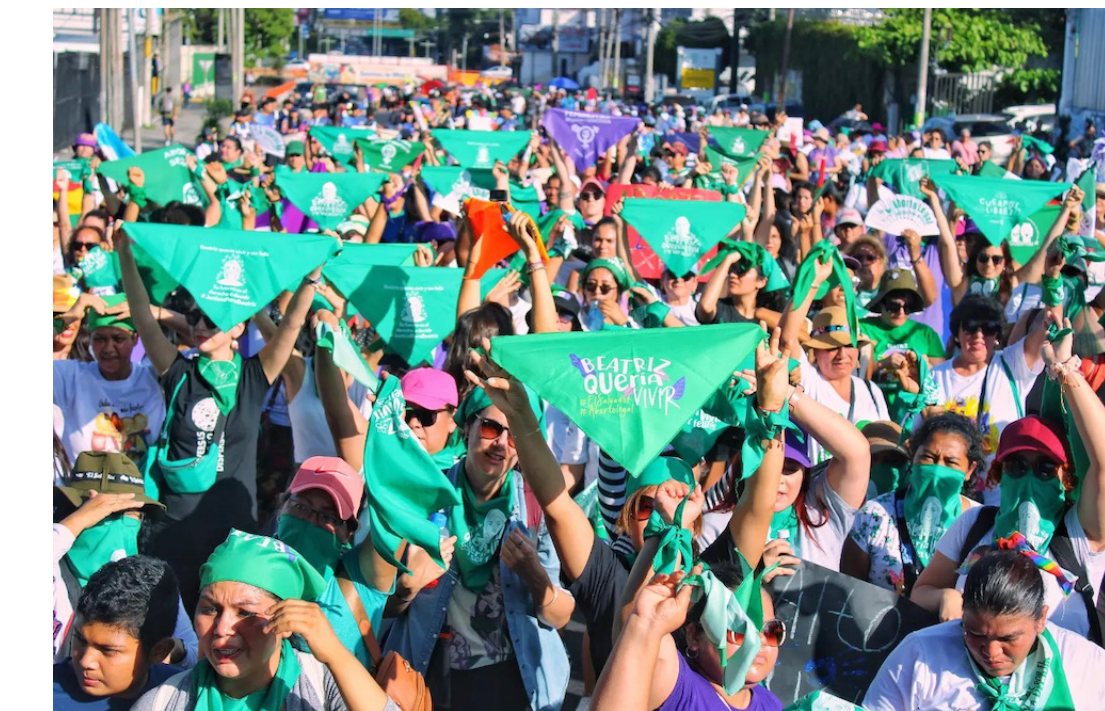
La Agrupación señala que no se retiran de la lucha, sino que seguirán como movimiento regional.

Sobre el contexto nacional, la Agrupación señaló que en estos años que Buke-