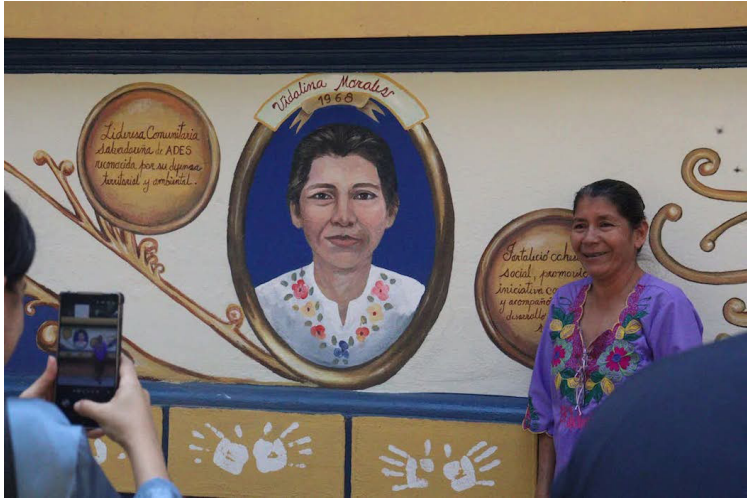
Estas intervenciones forman parte del activismo que transforma las paredes del Edificio Histórico de la Facultad de Jurisprudencia y Ciencias Sociales de la universidad.

Las obras murales (Campus Magma, Colores que hablan, mentes que sanan; Isital Nemilis y Raíces de Resistencia) abordan temáticas como la igualdad sustantiva, la salud mental, el ecofeminismo y el reconocimiento a mujeres referentes, explicó la entidad universitaria.