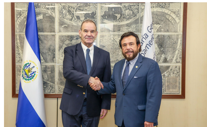
El vicepresidente Félix Ulloa se reúne en Madrid con Andrés Allamand, secretario general iberoamericano, para dialogar sobre los preparativos de la XXX Cumbre Iberoamericana.

El funcionario defendió la legalidad de la medida, “no estamos haciendo nada que no ten-