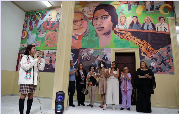
Las piezas buscan abrir diálogo sobre temas como igualdad, salud mental, ecofeminismo y el reconocimiento de mujeres que han sostenido luchas sociales en el país.