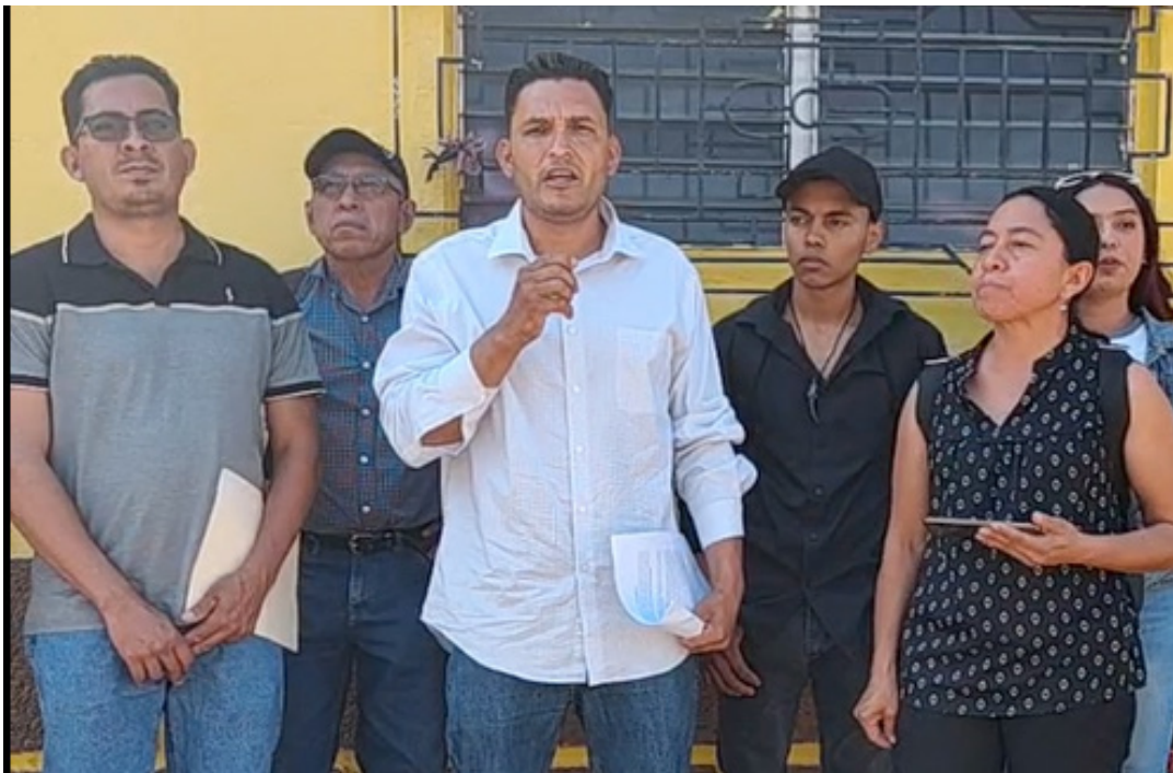
Comunidad FGR: San Francisco Angulo es una comunidad que lucha contra un relleno sanitario en la zona. Recientemente fueron víctimas de acoso policial en su propia comunidad.