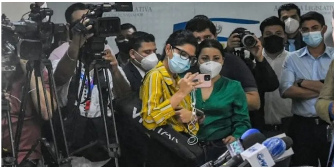
Entre los responsables de amenazas contra mujeres periodistas comunitarias se encuentran agentes policiales o militares, funcionarios públicos y simpatizantes del oficialismo.

Según la APES, el enfoque de género permite explicar por qué esta inseguridad se distribuye de manera diferenciada.