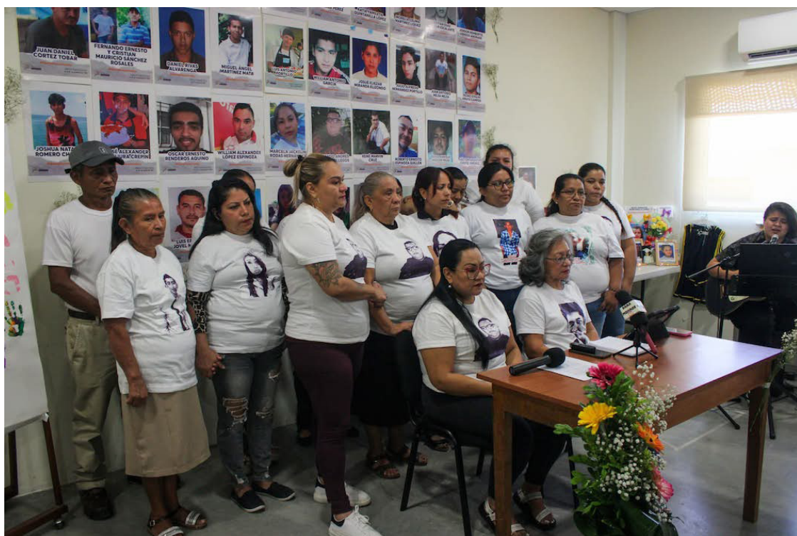
“El gobierno niega la existencia de desapariciones. Hay una negación, y por lo tanto no quieren aceptar esta realidad”, afirmó el Bloque de Búsqueda de Personas Desaparecidas.

“Reiteramos nuestro compromiso con nuestros desaparecidos y desaparecidas. Como familias, desde el amor, el recuerdo y la esperanza, seguiremos en este camino de lucha hasta encontrarlos”, concluyeron.