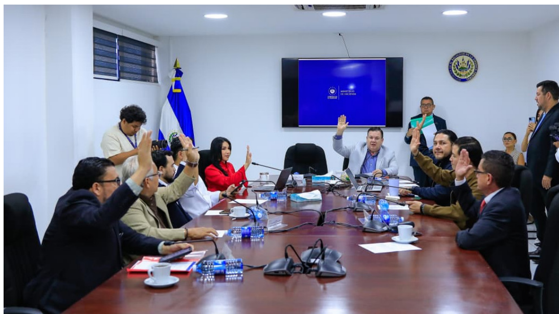
Asamblea aprueba préstamo por $75 millones para financiar la fase II de Doctor SV.