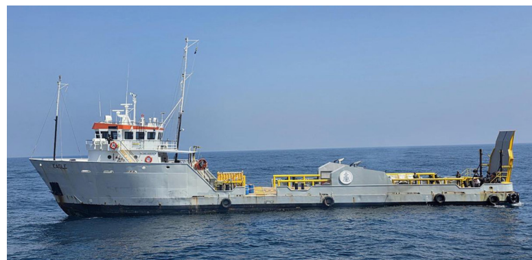
Este es el barco que la Marina Nacional incautó con 6.6 toneladas de droga.

tráfico. Por cierto, gracias por el nuevo barco”, finalizó Bukele en sus redes sociales.