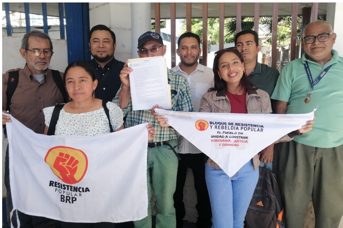
Líderes comunales, habitantes y representantes de organizaciones sociales presentan una demanda de amparo en contra de la construcción del relleno sanitario en San Francisco Angulo.

Fran Omar recordó que en 2018, hubo una resolución de la Procuraduría para la Defensa de los Derechos Humanos (PDDH) donde dio medidas cautelares a fin de suspender la construcción del relleno sanitario. “Una serie de acciones que desarrolló la Procuraduría para la Defensa de los Derechos Humanos, investigaciones en donde determinaba que el espacio no era adecuado para la construcción de un relleno sanitario como se ha venido planteando”. “Nosotros damos por hecho a partir de esa resolución y de todos esos procesos que se desarrollaron en el 2018 que el proceso ya está agotado y a par-