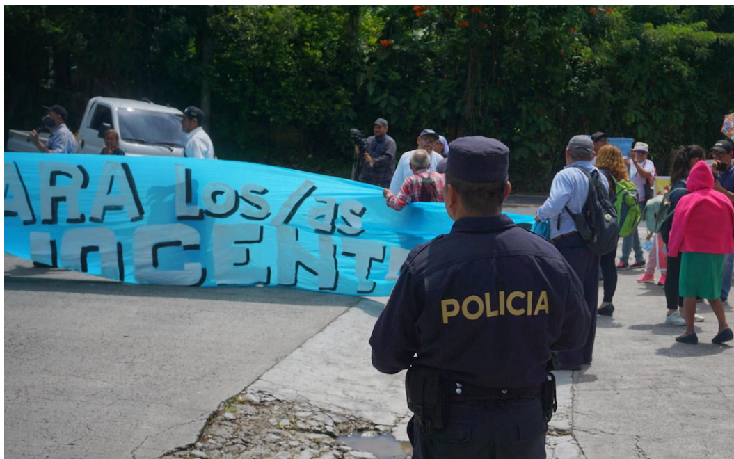
HRW denunció que el gobierno ha intensificado los ataques contra periodistas, defensores de derechos humanos, activistas y líderes sindicales durante el 2025.

Además, la Corte Suprema de Justicia clasificó como reservada la declaración patrimonial del presidente Bukele, rompiendo con la práctica institucional previa.