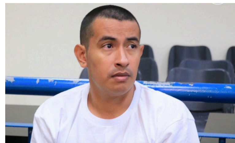
Los sujetos condenados abandonaron a un migrante en México.

El primero de los condenados, quien se encuentra en calidad de rebelde, deberá pagar a la víctima $5,000 en concepto de responsabilidad civil, mientras