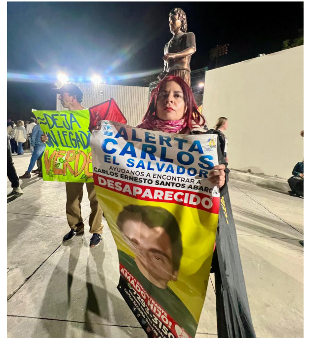
Ciudadanos organizados se concentran en las afueras del Estadio Jorge "El Mágico" Gonzáles, donde Shakira ha dado los primeros conciertos para a fin de que escuche los problemas medioambientales y la desaparición de personas en El Salvador.

También, pidió defender la vida de más de 400 familias, amenazadas por una empresa constructora