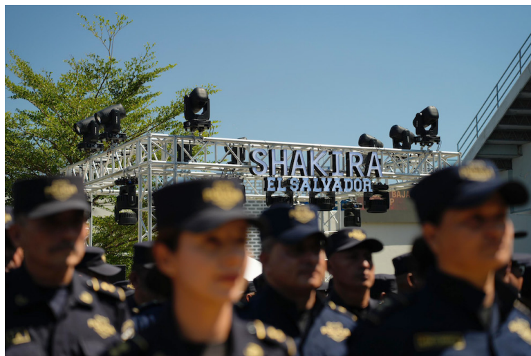
Shakira se presenta en el Estadio Jorge “El Mágico” González como parte de gira mundial “las mujeres ya no lloran”.

“El Salvador te recibe con amistad, pero, también con el dolor y luto de