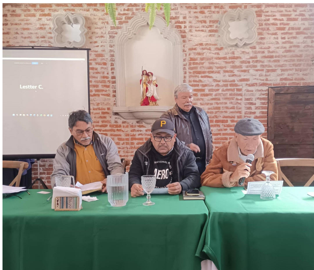
Tres empresas han tratado de hacer viable la mina Cerro Blanco: Entremares S.A., Goldcorp y Bluestone Resources; pero han fracasado en su intento debido a la negligencia técnica y a la resistencia de las comunidades de Asunción Mita y de El Salvador que han defendido el agua y el territorio.

“A la fecha, se trata de un proyecto fracasado que no ha extraído oro ni plata en 18 años, y que se ha mantenido vigente únicamente por la corrupción y negligencia de funcionarios del Ministerio de