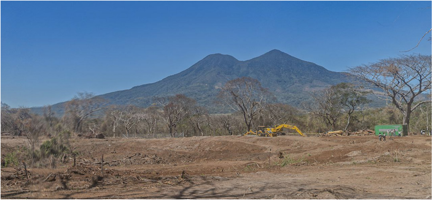
Este es la zona donde se observa que la empresa mexicana ya inició operaciones con la deforestación de árboles centenarios.