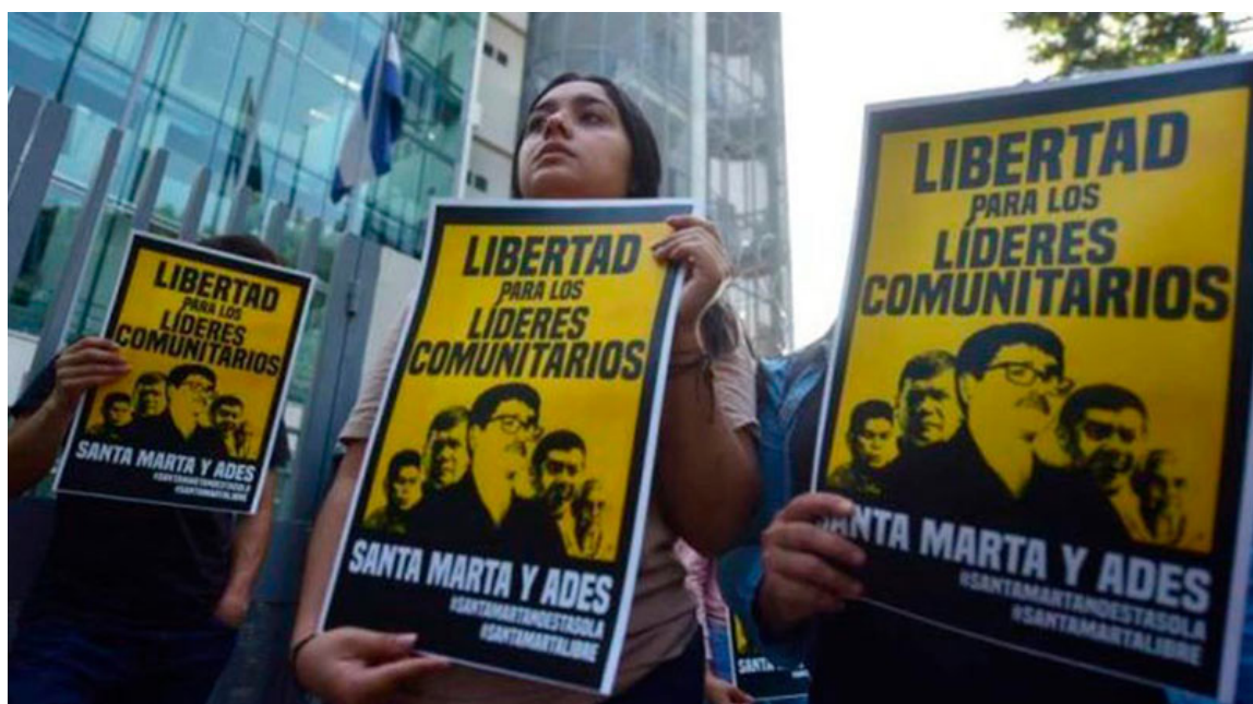
Comunidad Santa Marta preocupada por la posibilidad que se abra un nuevo proceso contra los líderes ambientalistas.

Sin embargo, se sabe que a dos de estas personas se les pretende dejar abierta la posibilidad de un proceso por la vía civil, lo cual no tiene lógica. Si no existe condena penal, no se puede condenar civilmente a alguien. En un proceso civil se exigirían las mismas pruebas y testimonios, y si estos no se sostuvieron en el juicio penal, tampoco lo harán en uno civil”, concluyó.