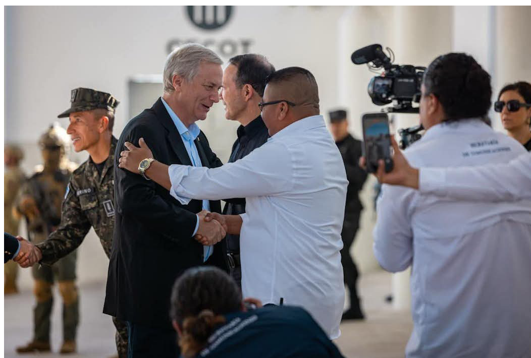
En el marco de su gira por Centroamérica, el presidente electo de Chile, el conservador José Antonio Kast, visitó el CECOT y solicitó a El Salvador cooperación para fortalecer el sistema penitenciario.

“Funciona como un reclamo publicitario. Ese es el punto. Esa es la verdadera razón de por qué existe el CECOT”, concluyó.