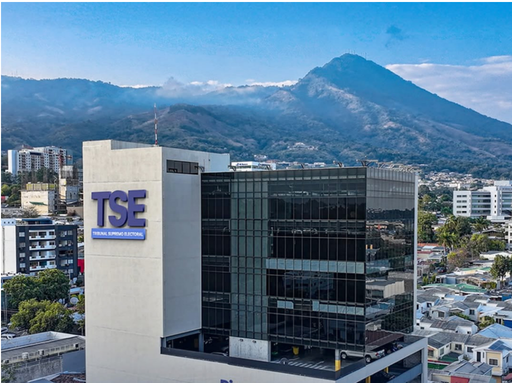
El Tribunal Supremo Electoral mantiene información desactualizada según el monitoreo de Acción Ciudadana.

Al comparar este tercer monitoreo con los dos anteriores, se observa “que no existen avances sustantivos en materia de transparencia activa”. “Aunque entre el primer y segundo monitoreo se corrigie-