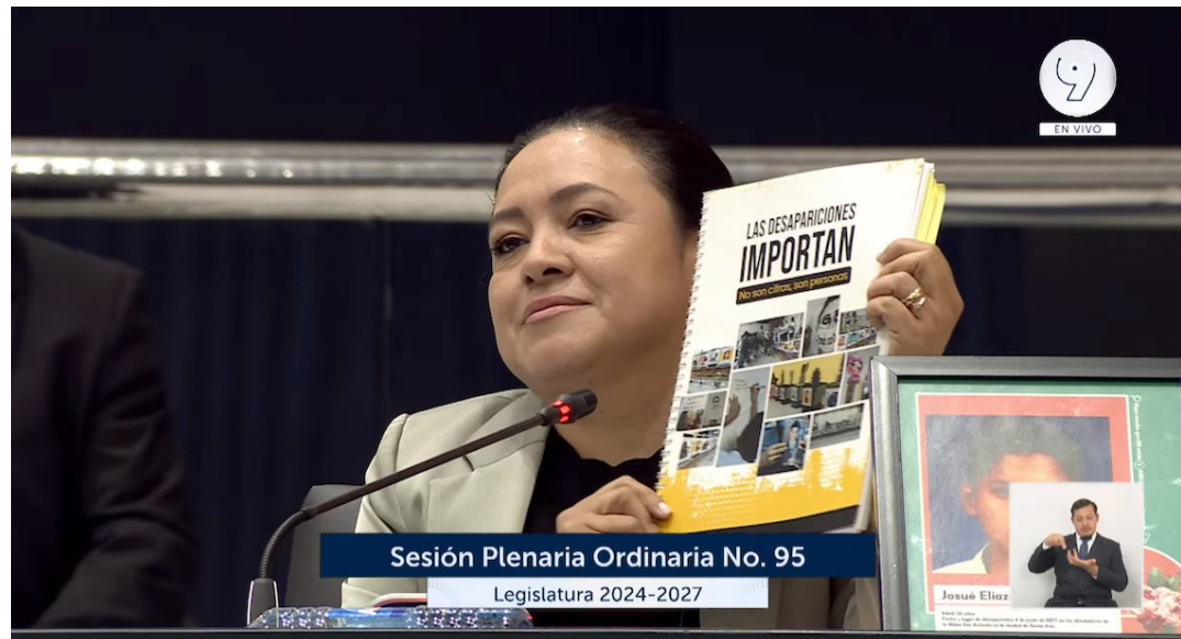
La diputada de VAMOS, Cesia Rivas, presenta en la Asamblea Legislativa una propuesta de Ley de Búsqueda de Personas Desaparecidas.

“Ellos sí importan, no son solo números, son personas, son familias destruidas que no dejan de buscarles ¿y qué han encontrado?, una fiscalía que deja mucho que desear y ha pausado sus investigaciones”