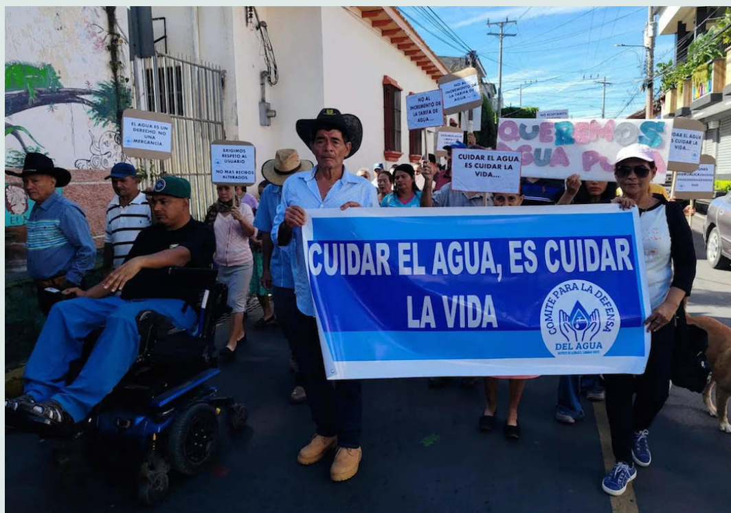
El 17 de enero, habitantes de Ilobasco salieron a manifestarse por los incrementos de más del 100% en la tarifa de agua potable.

“En un inicio se nos dijo que Agrocontinental solo estaba administrando el servicio, pero que en los próximos meses pasaría a ser la propietaria. Paradójicamente, en la primera reunión que sostuvimos, el mismo representante legal de Inversiones Hidráulicas también representaba a Agrocontinental, lo cual nos pareció absurdo”, denunciaron.