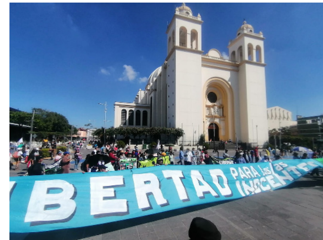
El Movimiento de Víctimas del Régimen (MOVIR) pide la eliminación del estado de excepción porque con él se ha detenido a miles de personas que nada tienen que ver con pandillas.

El consejo de ministros indica que las medidas extraordinarias decretadas “han tenido un exitoso resultado” que ha logrado la reducción del número de homicidios y la captura de más de 91,000 presuntos terroristas; “ciertamente es necesario prolongar dicho régimen de excepción, en lo referente a las medidas extraordinarias, vinculadas a la limitación de los derechos contenidos en los artículos 12, 13 y 24 de la Constitución, que en este momento son las que resultan ser las necesarias para continuar las actividades operativas de seguridad”.