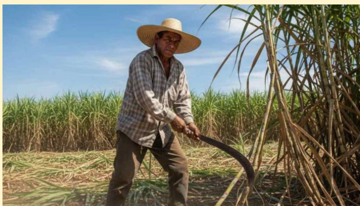
Este dictamen será aprobado el jueves en la sesión plenaria ordinaria.