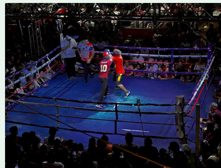
Imagen de una pelea popular en Sonsonate.

Ante la gravedad de los hechos, el Instituto Nacional de los Deportes de El Salvador (INDES) debe tomar cartas en el asunto de manera inmediata, abrir la investigación correspondiente y de-