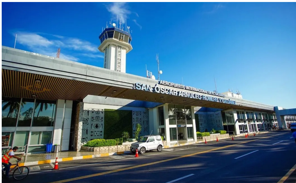
El Aeropuerto Internacional se modernizará con un empréstito suscrito entre el Gobierno y el BID.

La Comisión dictaminó a favor de la ratificación de dicho préstamo, el cual será conocido por el pleno el jueves en sesión plenaria.