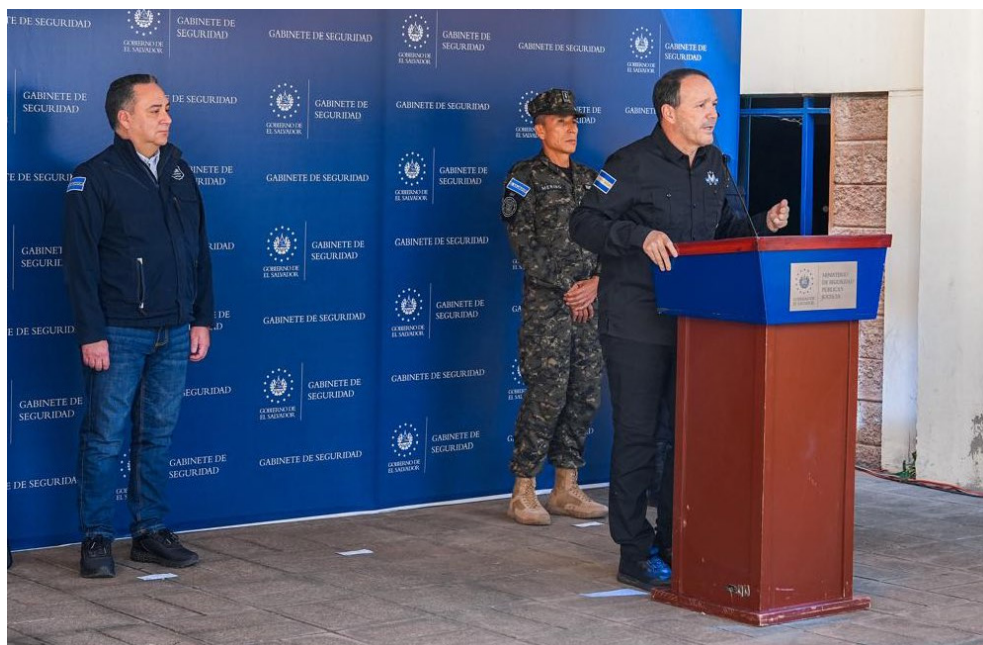
Autoridades de Seguridad señalan que no existe riesgo sobre este modus operandi, por lo que instan a los salvadoreños que si son víctimas de estas, ignorelas o bloquen los números.