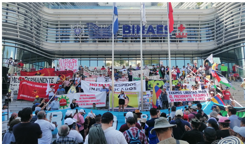
La marcha inicia desde el Parque Cuscatlán y finaliza en la BINAES, en el Centro Histórico de San Salvador.

Una de ellas de Fran Omar, del BRP, quien invitó a que “todos los días tenemos que construir un futuro mejor, el que necesitamos todos y todas. Hay que construir esa verdadera esperanza y alternativa”.