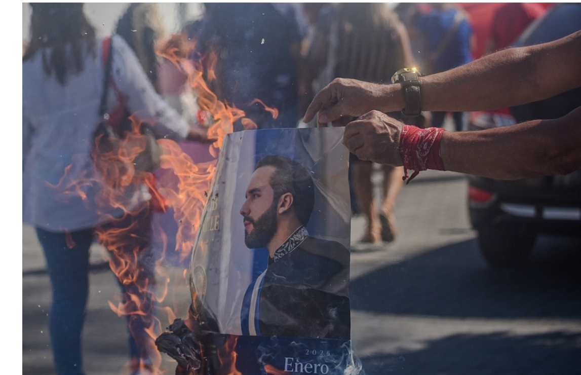
Durante el recorrido, dos ciudadanos no identificados quemaron un calendario del presidente de la República, Nayib Bukele, como forma de descontento hacia su forma de gobernar.

“Desde ese entonces, mes a mes, gota por gota de san-