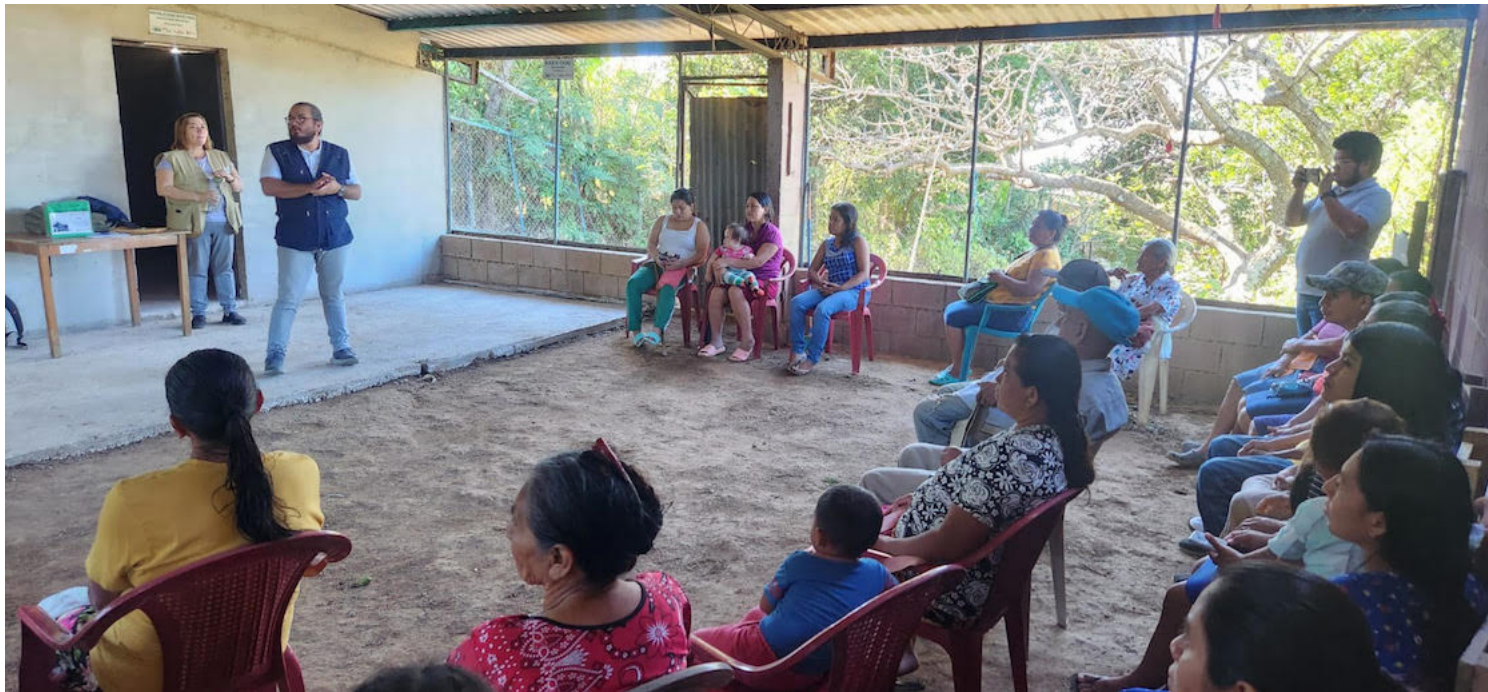
Las acciones de resiliencia comunitaria se fortalecerán con la próxima entrega de aves multipropósito, con el objetivo de reforzar los medios de vida de las familias más afectadas.