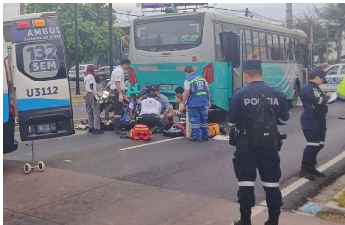
Según versiones preliminares, el joven que chocó contra la unidad de R52 se habría dormido luego de salir de su trabajo.

da tras perder el control de la motocicleta y derrapar en el paso a desnivel del monumento Bienvenido a Casa. El accidente ocurrió debido a que la vía se encontraba cubierta de aceite derramado, producto de otro percance vial registrado previamente en la misma zona. De acuerdo con socorristas de Cruz Verde Salvadoreña, la