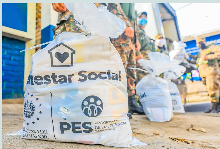
EUROFISH, S.A. donará cien mil latas de atún al Gobierno de El Salvador para programas sociales. En pandemia, las bolsas solidarias incluían atunes.

La normativa busca la exoneración al MAG del pago de todo tipo de impuestos, incluyendo los Derechos Arancelarios a la Im-