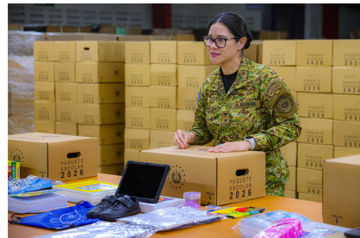
La ministra de Educación, Karla Trigueros, presenta el contenido del paquete escolar 2026, el cual se adquirió con empresas extranjeras.

Sobre la decisión de comprar a una empresa extranjera y no a artesanos locales, el tricolor lamentó que no se promueva la participación de la Micro y Pequeña Empresa, a pesar de que la Ley lo esta-