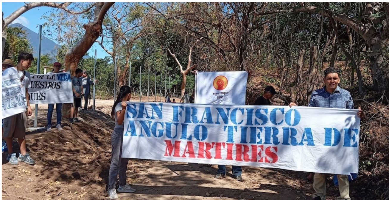
El MUPC reveló que la Fiscalía General de la República (FGR) estaría preparando órdenes de captura contra personas que están defendiendo el derecho a la vida y el derecho a la tierra en Tecoluca.