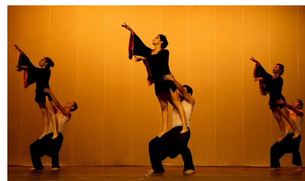
La reforma a la Ley de Compras Públicas permitirá contratar profesionales del Ministerio de Cultura como docentes por horas clase para impartir cátedras de música, danza, artes plásticas, artes dramáticas y otras disciplinas.

Por ello, las modificaciones añaden un literal al artículo 3 de dicha ley, para excluir de dicha inhabilitación a los empleados del Ministerio de Cultura con especialidad artística para impartir cátedras de música, danza, artes plásticas, artes dramáticas y otras disci-