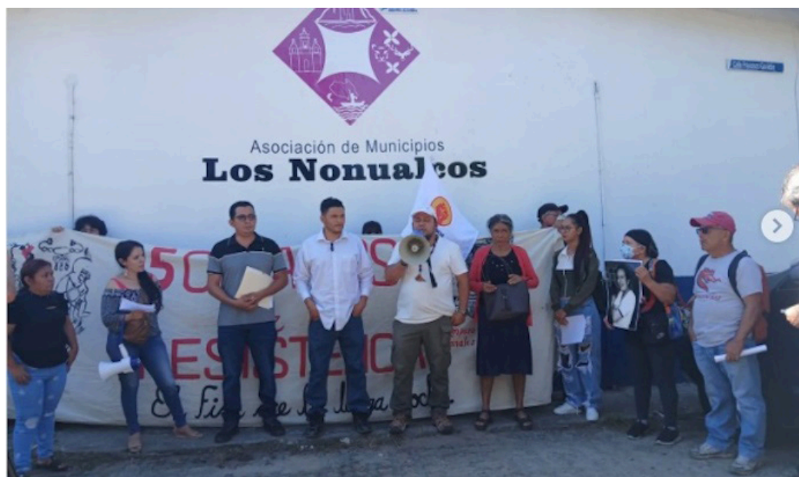
El Movimiento popular, como el Círculo Universitario de Pensamiento Crítico (CUPC), y el Bloque de Resistencia Popular (BRP) apoyan a la comunidad de San Francisco Angulo, Tecoluca, en su lucha contra la instalación de un relleno sanitario.

El movimiento cuestionó los mecanismos de diálogo impulsados por las autoridades. “Esto no es