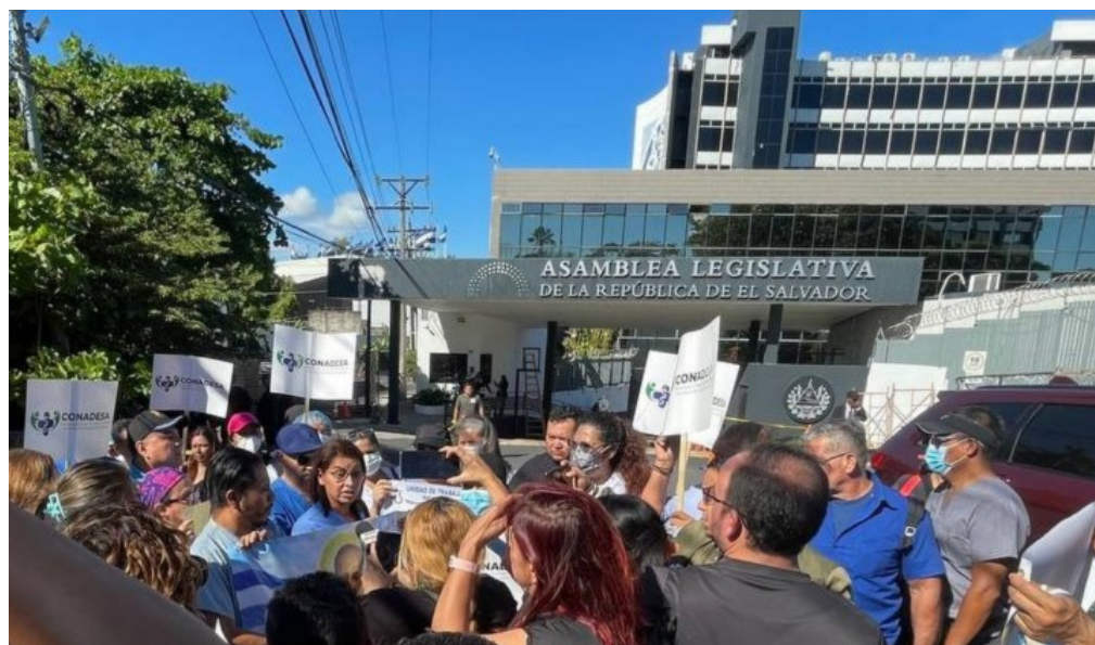
Personal despedido del Hospital Rosales se concentran en la Asamblea Legislativa en búsqueda de apoyo de los diputados para que el Gobierno les entregue el pago completo de su indemnización tras su despido en diciembre de 2025.

En diciembre del año 2025, fueron despedidos alrededor de 1,800 empleados de salud que se encontraban en el Hospital Rosales. El despido fue por parte de Presidencia según lo cuentan