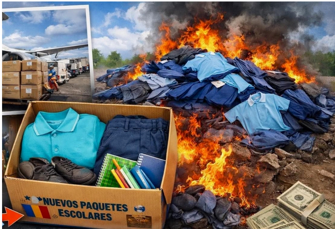
La Dirección Nacional de Educación retiró uniformes escolares que no fueron entregados el año pasado, los cuales serán destruidos.

Esta semana la ministra de Educación, Karla Trigueros, verificó en el aeropuerto