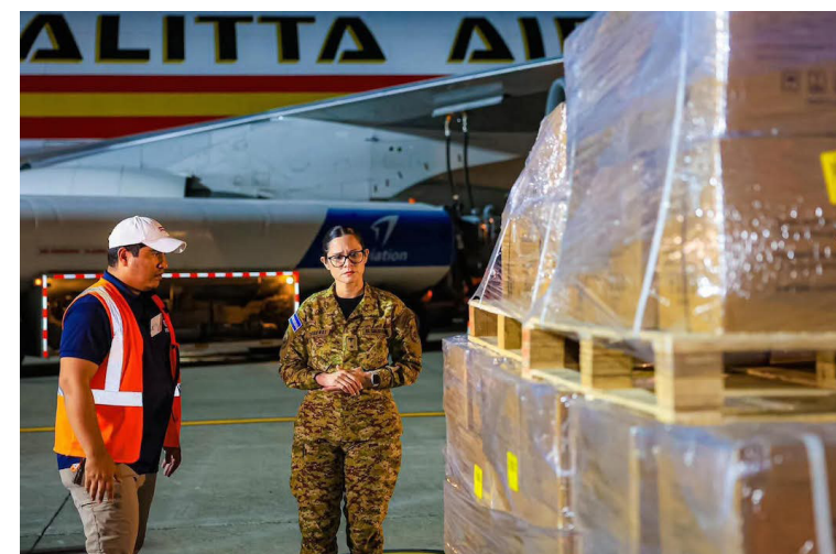
La ministra de Educación, Karla Trigueros, verifica el cargamento de uniforme escolares comprados a Brasil, dejando excluidos a los sastres y zapateros del país.

El inicio de las clases en las instituciones educativas del sistema público, está previsto para el próximo 2 de febrero.