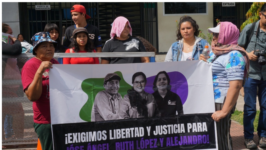
Amnistía Internacional considera que las detenciones a los defensores de derechos humanos no son hechos aislados, sino que forman parte de un patrón sistemático de criminalización que busca silenciar a quienes denuncian abusos.