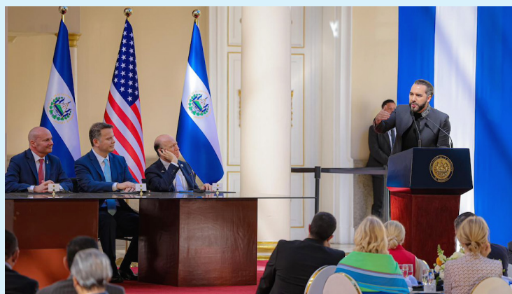
Bukele habla sobre su política de seguridad y señala que no ha habido “ninguna baja civil” en la guerra contra las pandillas.

ques de queda, controlaban quién podía ir de un lugar a otro lugar, ponían impuestos, el 80% de los negocios pagaban impuestos, más del porcentaje que pagan ahora. Y el que no pagaba los impuestos era asesinado por no pagarlos.”