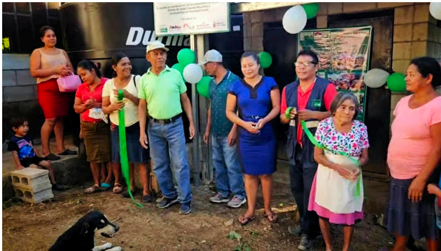
Por su ubicación en el corredor seco centroamericano, El Salvador se encuentra entre los países más vulnerables al cambio climático, expuesto a fenómenos extremos como sequías prolongadas, olas de calor y lluvias intensas.

PROVIDA señaló que sus esfuerzos por garantizar el acceso sostenible al agua y al saneamiento responden también al avance de la deforestación, la contaminación ambiental y la ausencia de una protección efectiva de los ecosistemas por parte del Estado.