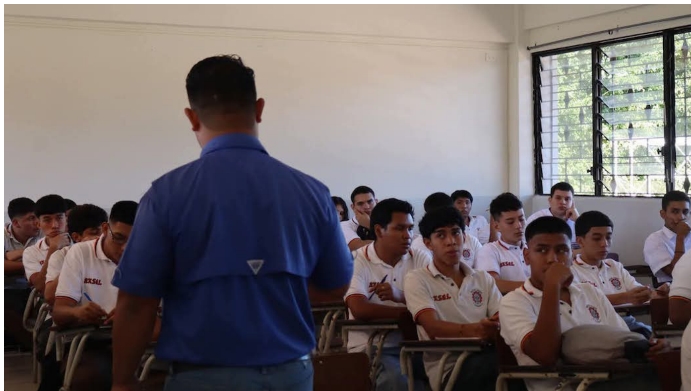
Cerca de 900 colegios privados inician el año lectivo 2026, cuya matrícula ronda los 160 mil estudiantes.

El presidente de ACPES señaló que la asfixia financiera es la principal razón por la cual los colegios cierran sus puertas, el nacimiento de nuevos colegios privados cada año es menos.