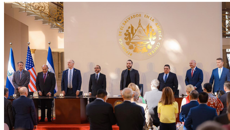
La actividad fue desarrollada en el Palacio Nacional, en San Salvador, para promover valores que fortalezcan la paz y la visión compartida de un país en transformación.

Asimismo, indicó que otros países han intentado replicar el modelo de transformación, con quienes se han compartido información, diseños de las cárceles y donde se han enviado equipos para trabajar en conjunto. Sin embargo, hasta hoy, ninguno ha obtenido los resultados alcanzados en El Salvador señalando que la razón es porque como pilar fundamental debe incluirse “la oración”.