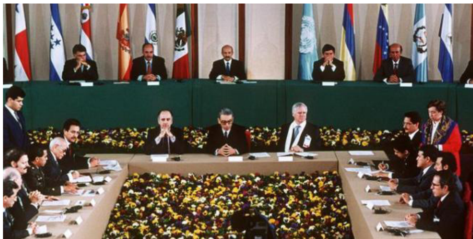
La Comisión de Derechos Humanos de El Salvador (CDHES) considera importante recordar y conmemorar los Acuerdos de Paz, que marcaron la historia del país y puso fin al conflicto armado.

La CIDHES consideró necesario seguir luchando, para que los acuerdos aún pendientes se cumplan, así como instituciones surgidas no se desnaturalicen de