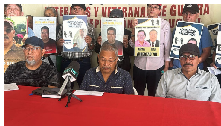
Los veteranos del FMLN reiteran que el proceso de paz salvadoreño demostró que el diálogo y la negociación, pueden solucionar conflictos sin importando el tamaño y severidad.

“El cese al fuego, la reducción del ejército, el desarme del ejército guerrillero, la distribución