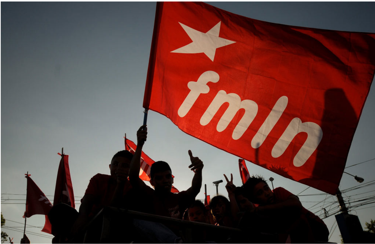
El FMLN conmemora cada año, la firma de los Acuerdos de Paz por el significado que le dio a la vida democrática de El Salvador.