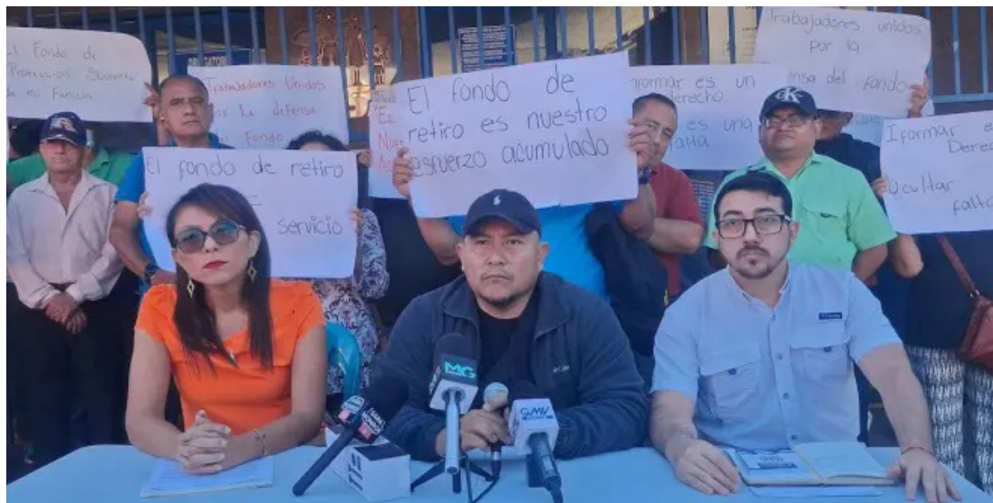
Alrededor de 20,000 empleados activos realizan aportes al fondo. Estiman que se manejan millones de dólares que actualmente estarían en riesgo.