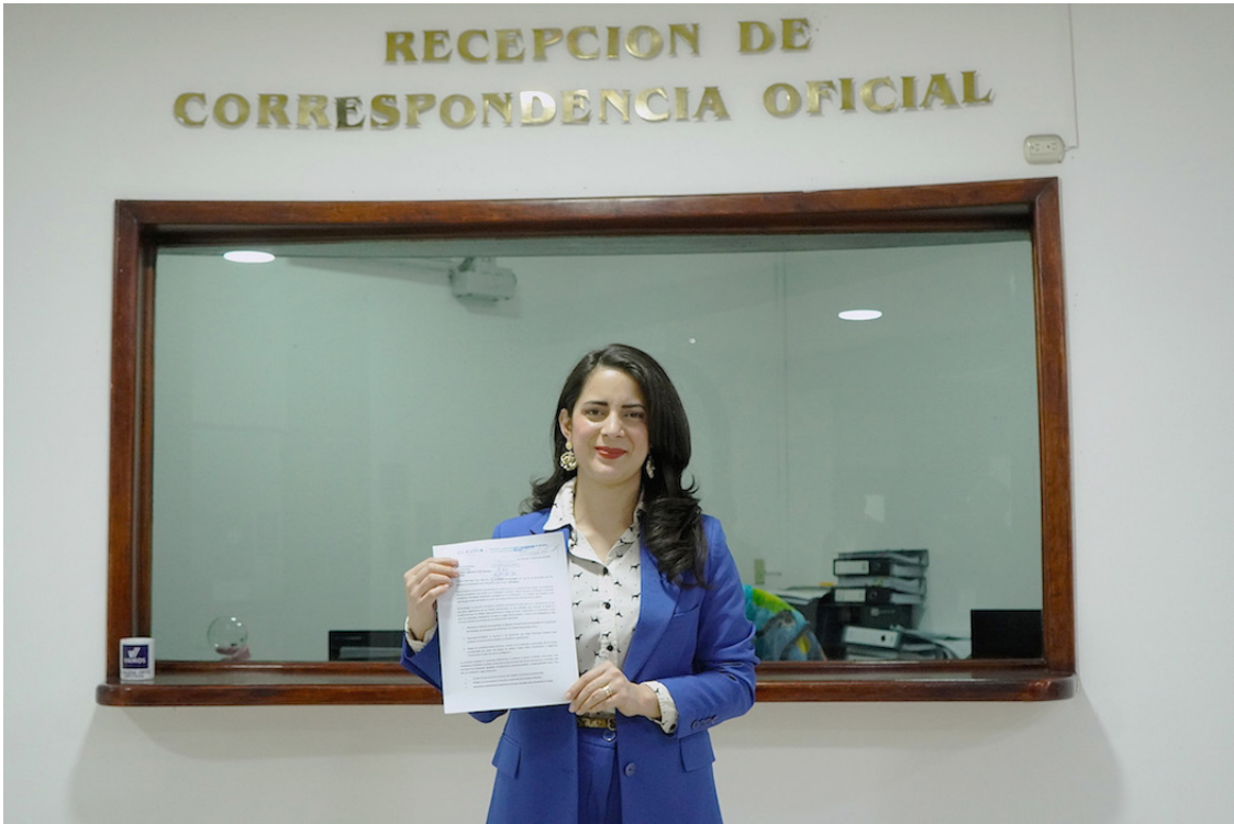
La legisladora señala que la iniciativa de ley va enfocada en proteger el fondo de pensiones del mismo Estado que ha abusado de los préstamos.

La legisladora planteó tres problemas significativos: el primero, es la afectación al derecho de propiedad, al disponer de los fondos previsionales sin condiciones de mercado, sin transparencia suficiente y sin límites temporales claros; el segundo, es la desproporcionalidad, al imponer a los cotizantes una carga financiera ex-