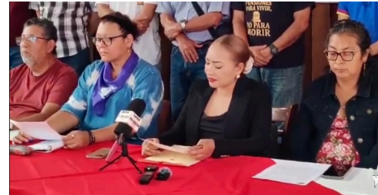
UNITRASAL indica que durante el año 2025 en el sector público hay más de 19,000 trabajadores despedidos, siendo los trabajadores del sistema de salud con más de 7,000 afectados.

La dirigente gremial manifestó que en muchas instituciones públicas y empresas privadas irrespetan gravemente el marco constitucional, la normativa jurídica, ac-