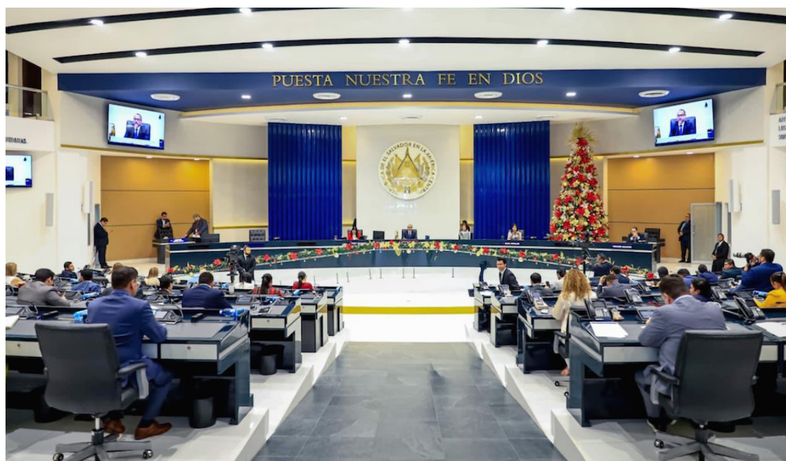
Asamblea Legislativa aprueba la Ley Quincena 25 vía dispensa de trámite sin informar de donde saldrán los fondos.

Durante la plenaria de este miércoles en la Asam-