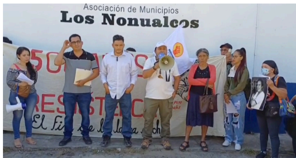
Las comunidades afectadas y organizaciones sociales presentan un escrito a la Asociación de Municipios Los Nonualcos, donde expresan su rechazo al relleno sanitario.