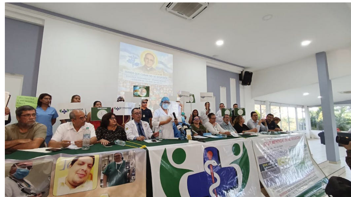
CONADESA brinda un balance sobre la situación de salud en el sistema público, dónde se ha caracterizado por el despedido masivo del personal.