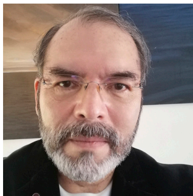
César Ramírez @caralvasalvador

W illiam Walker (1824-1860) filibustero estadounidense del siglo XIX emprendió una serie de aventuras militares de conquista desde México hasta Centroamérica, fue una especie de autoproclamado “profeta para restaurar el esclavismo y el “destino manifiesto” de Estados Unidos para llevar el desarrollo a otras naciones, considerándose una raza superior. El destino manifiesto se fundamenta en una nación “elegida” destinada a expandirse desde las costas del Atlántico al Pacífico, llamado el “mito de la frontera” 1 esa doctrina racista implica a los estadounidenses como “regeneradores” etc. en ese contexto surgen los filibusteros organizadores de cuerpos militares privados, ahora les llamaríamos “mercenarios” “soldados de fortuna” o simplemente “aventureros dinerarios”, con una codicia desproporcionada por territorios, metales