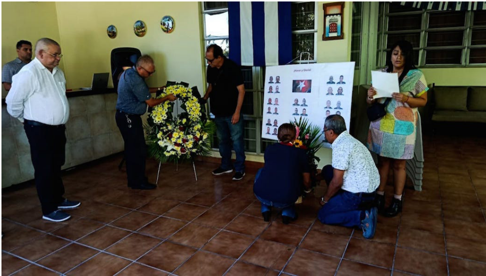
Movimientos sociales y personal de la Embajada de Cuba en El Salvador rinden un homenaje a los 32 héroes cubanos, que murieron en el cumplimiento de su deber, durante la agresión militar de Estados Unidos contra Venezuela.