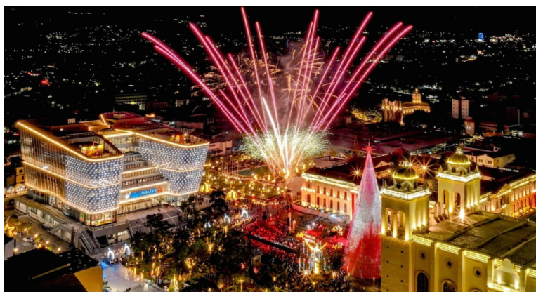
La villa navideña fue uno de los sitios con más afluencia de personas durante las festividades de Navidad y Fin de Año.

En segundo lugar, se ubicó Estados Unidos, siendo la diáspora la que visita el país en estas festividades, ellos en totalidad alcanzaron 1.3 millones de visitantes, 1.3 % más comparado con el 2024; y le sigue Honduras con 792,000 visitantes, con un crecimiento del 6 % comparado al año pasado”: presidente del Ins-