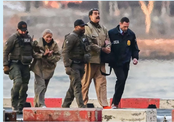
La Asociación Americana de Juristas (AAJ) condena la captura y privación ilegítima de la libertad del presidente de Venezuela, Nicolás Maduro, y su esposa, Cilia Flores.

Hasta el momento, el presidente Bukele no se ha pronunciado con una declaración.