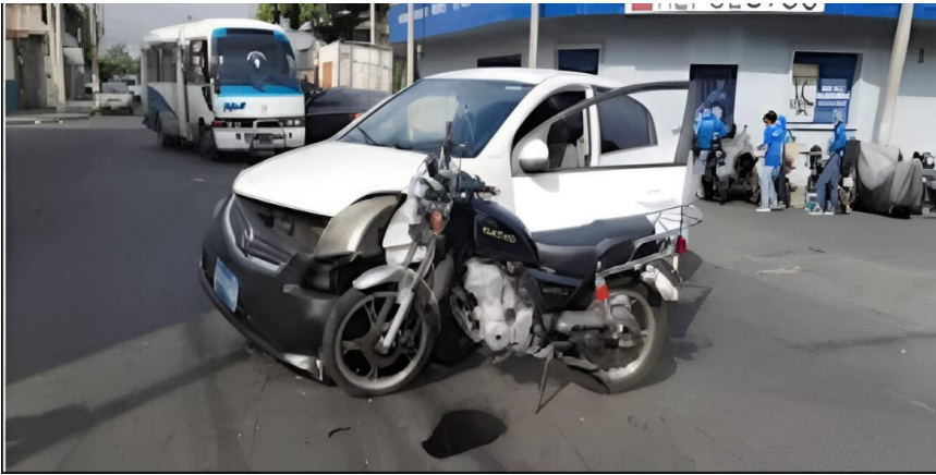
Luego de respetar una semáforo en rojo, el motociclista provocó un accidente de tránsito causándole lesiones a otro conductor.

vil (PNC) observaron al imputado en aparente estado de ebriedad, por lo que se le practicó la prueba de alcotest, la cual arrojó un resultado de 137 grados de alcohol en aliento, motivo por el cual fue detenido en flagrancia. Es de recordar que las autoridades arrestan a todos los conductores que presentan algún grado de alcohol en sangre.