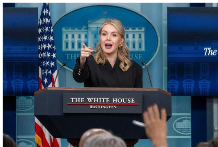
Imagen de la secretaria de Prensa de la Casa Blanca, Karoline Leavitt, asistiendo a una conferencia de prensa diaria en la Casa Blanca, en Washington D. C., Estados Unidos.

Leavitt señaló que “el presidente Trump ha dejado saber con claridad que adquirir