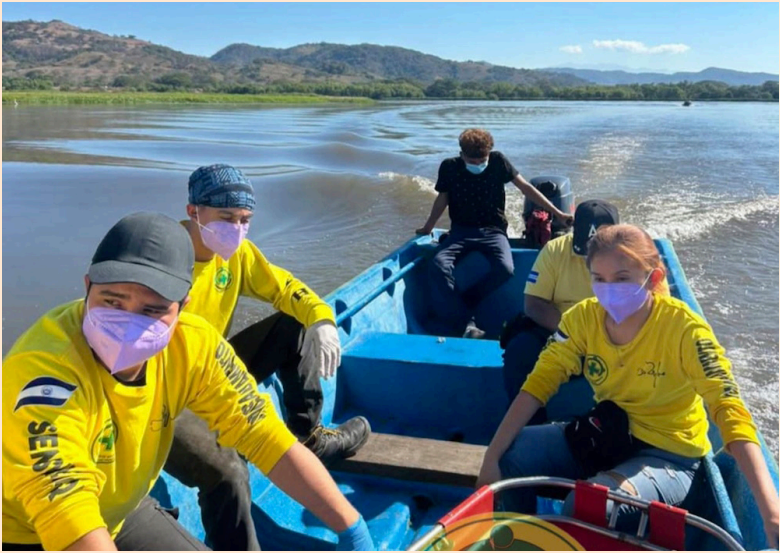
Las labores de búsqueda empezaron desde el domingo 4 de enero y se contó con el apoyo de la Unidad de Buzos de Rescate.

“Las operaciones se desarrollaron manteniendo el área