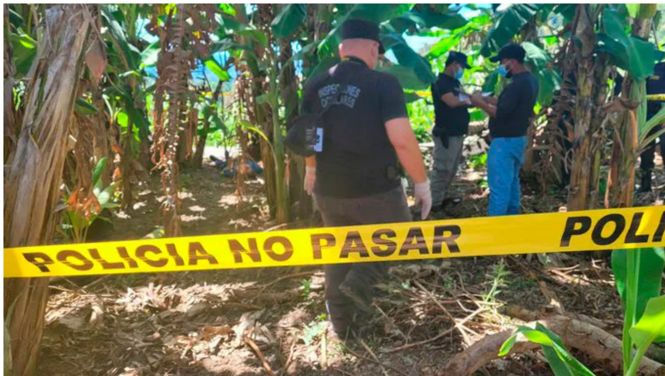
En 2025 se contabilizaron 82 homicidios. Los responsables fueron capturados, según informó el Gabinete de Seguridad.

Las autoridades informaron que, en el 2025, se logró la incautación de más de 25 mil kilogramos de droga, con un valor en el mercado superior a 620 millones de dólares.