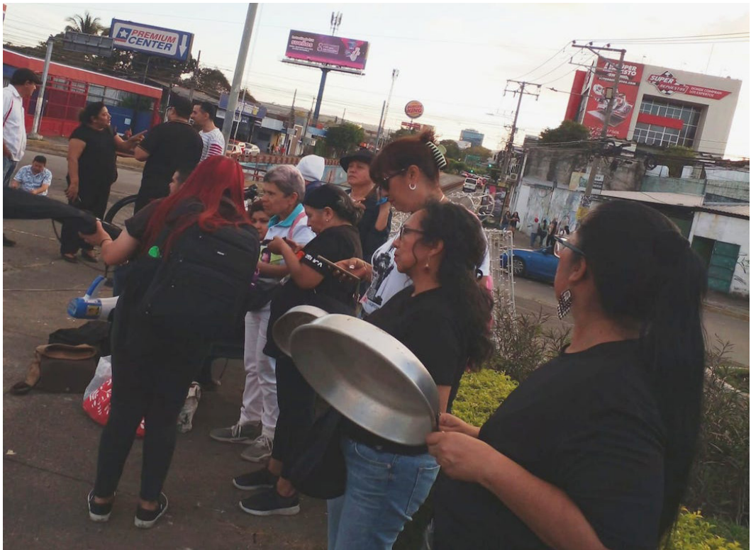
El Movimiento para la Defensa de la Clase Trabajadora (MDCT) llevó a cabo un acto de protesta denominado “Cacerolazo por otra negra Navidad”, en rechazo por los miles de despedidos del sector público.

Indicó que para detener esta medicina amarga prometida por Bukele, es fundamental la organización del pueblo y el aumento en la lucha popular, solo el pueblo organizado puede garantizar la defensa de los derechos laborales, el acceso a la salud y a los demás servicios públicos.