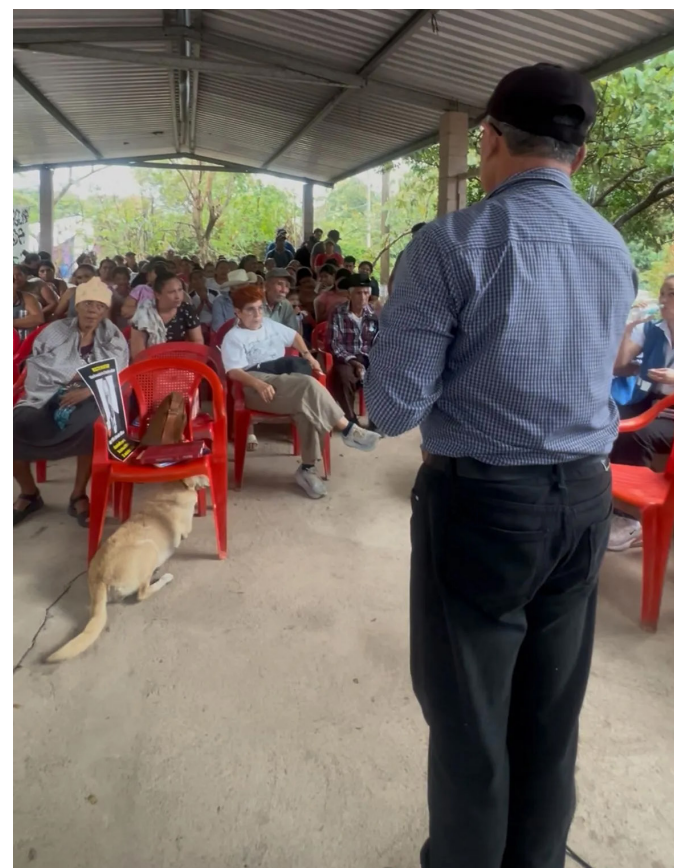
Líder de la Comunidad San Francisco Angulo también informa a la comunidad.

Especial preocupación generaron las visitas de funcionarios