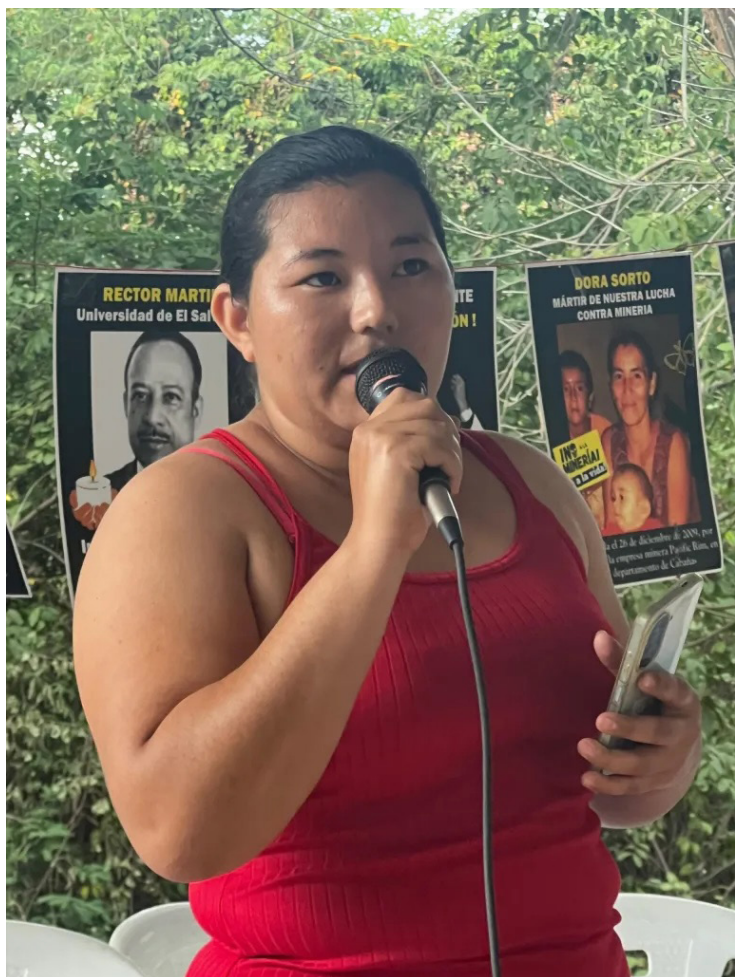
Lideresa de la comunidad San Francisco Angulo, informa a los habitantes de la comunidad.