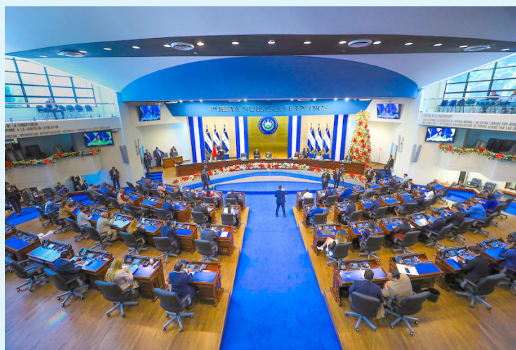
La Asamblea Legislativa aún no ha dado a conocer públicamente su presupuesto para 2026, a pesar que todas las instituciones lo han hecho público.

El presidente de la Asamblea Legislativa, Ernesto Castro, dijo que, en esta semana, la Comisión de Hacienda iba a discutir el presupuesto del Legislativo. Es de recordar que, los legisladores deben aprobar su presupuesto