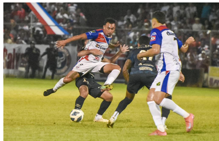
Alianza le propina 5-0 a Firpo en la jornada 14 del Apertura 2025.

Esta serie trae como antecedente, el empate de la primera