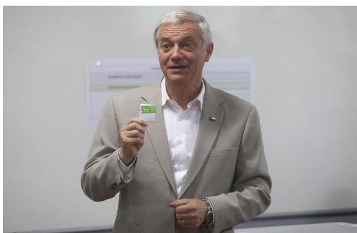
Imagen cedida por la Agencia de Noticias de Chile AGENCIA UNO de José Antonio Kast, emitiendo su voto durante la segunda vuelta de la elección presidencial en el colegio Ana María Mogas, en la comuna de Paine, en la provincia de Maipo, en la Región Metropolitana de Santiago, en el centro de Chile.

"La democracia habló fuerte y claro. Me acabo de comunicar con el presidente electo José Antonio Kast para desearle éxito por el bien de Chile", dijo Jeannette Jara, exministra del Trabajo y Previsión Social del Gobierno del mandatario Gabriel Boric. Jeannette Jara, militante del Partido Comunista, agregó que "a quienes nos apoyaron y fueron convocados por nuestra candidatura, tengan claro que seguiremos trabajando por avanzar en una mejor vida en nuestra patria. Juntos y