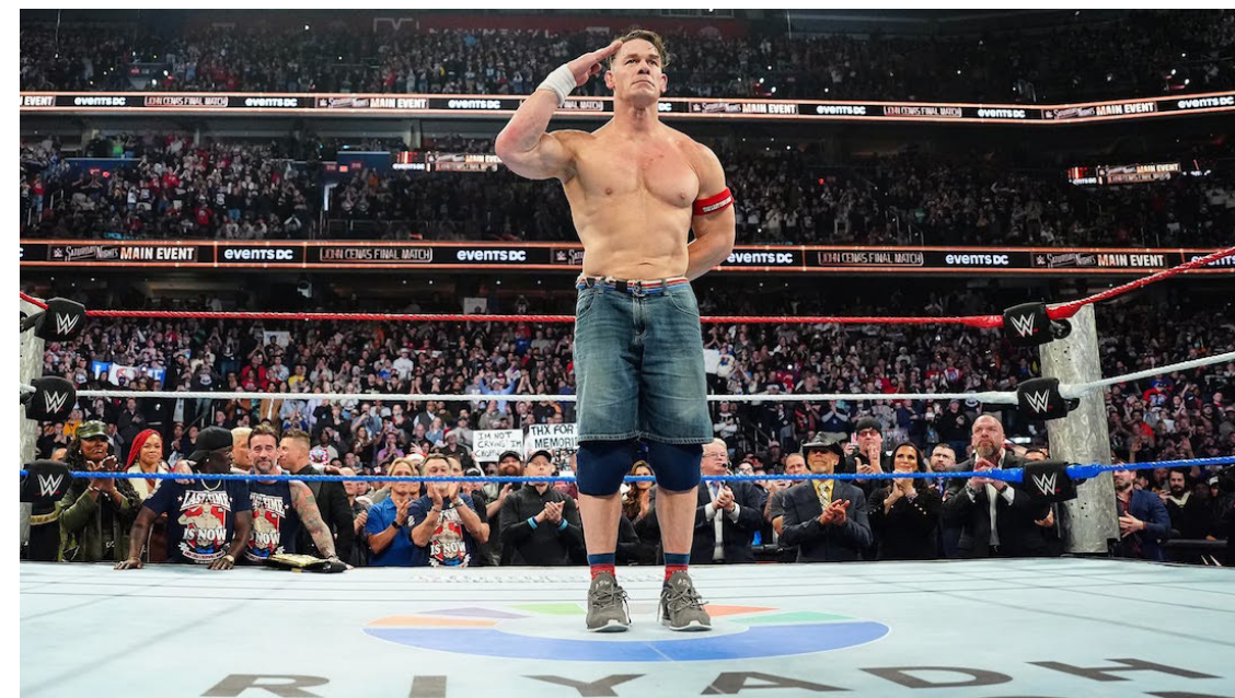
John Cena se retira de la WWE luego de 23 años en la industria, dejando a millones de fanáticos con el agradecimiento de haber formado parte de su vida, sobre todo en su niñez.

Oriundo de Boston, Massachusetts, “el superhéroe de los niños” iniciaría su trayectoria en la lucha libre a finales de los años 90’, época fuertemente influenciada por el auge del fisicoculturismo en Estados Unidos, disciplina que —en conjunto con su forma-