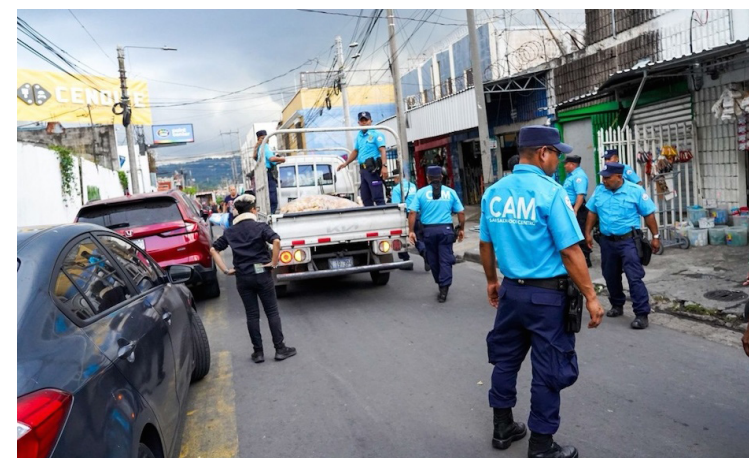
Comerciantes informales del Centro de San Salvador se encuentran en disputa con agentes del CAM por sus ventas, ya que las comuna les ha prohibido vender en zonas libre de ventas.

Los comerciantes piden a las autoridades que los dejen trabajar para la temporada navideña, ya que es cuando las ventas tienden a incrementarse. Comerciantes denunciaron que las autoridades han acreditado a cierto grupo de vendedores de aguas en las plazas centrales, pero no fue equitativo.