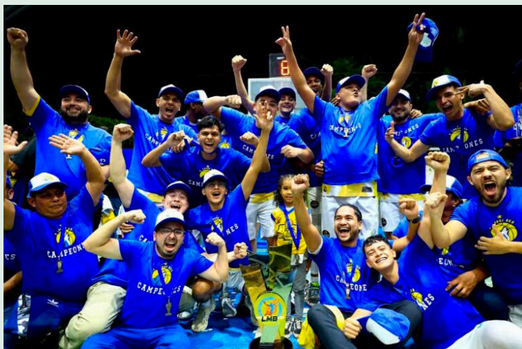
Lobos BKB celebra su primer título en la Liga Mayor de Baloncesto al privar de su hegemonía a Metapán.

Epeloa también resaltó el peso de haber eliminado a ri-