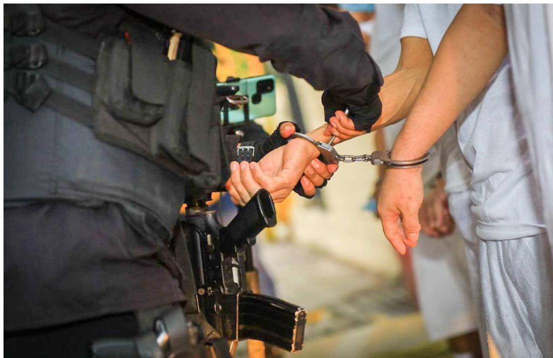
El gobierno de Nayib Bukele bajo el argumento del combate a la seguridad y delincuencia, ha encarcelado a muchas personas de forma injusta.

“Algo tiene que ver con todo lo que está pasando en estos momentos en el mundo, en la geopolítica, y vulneración de derechos humanos, vemos