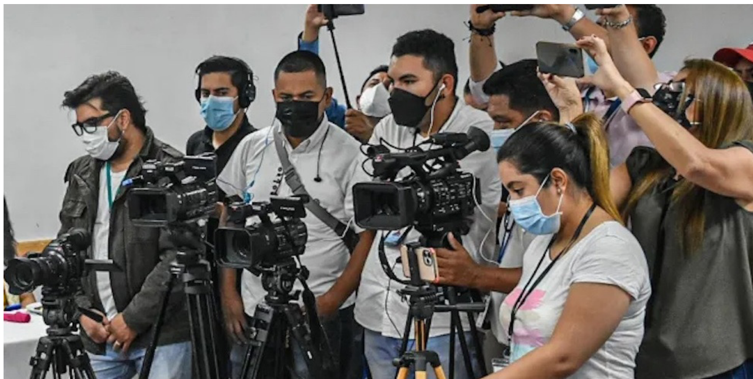
Un informe de Reporteros sin Fronteras (RSF) revela que el odio a los periodistas ha provocado el asesinato de 67 reporteros este año.

Los reporteros locales pagan el precio más alto, solo dos periodistas extranjeros han sido asesinados fuera de su país. El fotoperiodista francés Antoni Lallican, asesinado por un ataque con drones rusos en Ucrania, y el periodista salvadoreño Javier Hércules, asesinado en Honduras, donde vivía desde hacía más de diez años, a todos los demás los mataron mientras se dedicaban a cober-