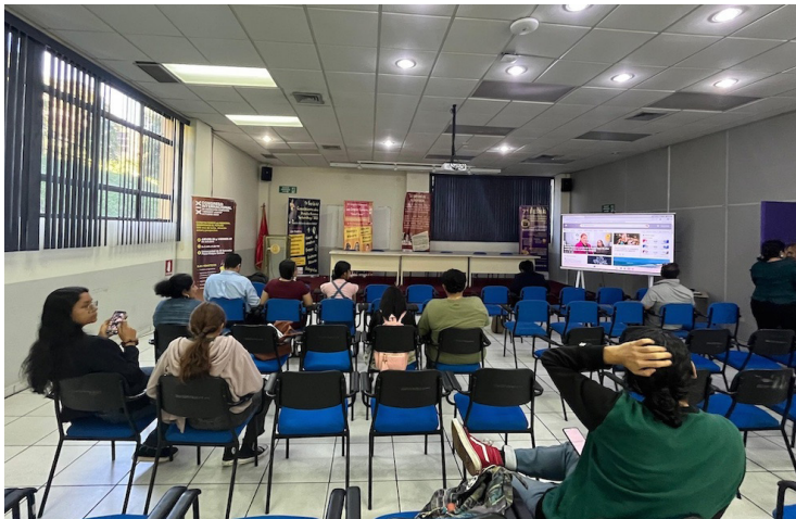
El Colectivo Herbert Anaya Sanabria reconoce la labor de los jóvenes en materia de derechos humanos.