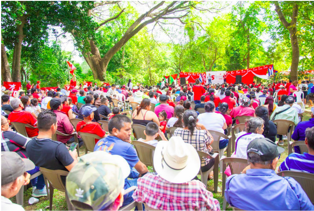
El Frente Farabundo Martí para la Liberación Nacional (FMLN) decidió participar en las elecciones presidenciales, legislativas y de las alcaldías de 2027.