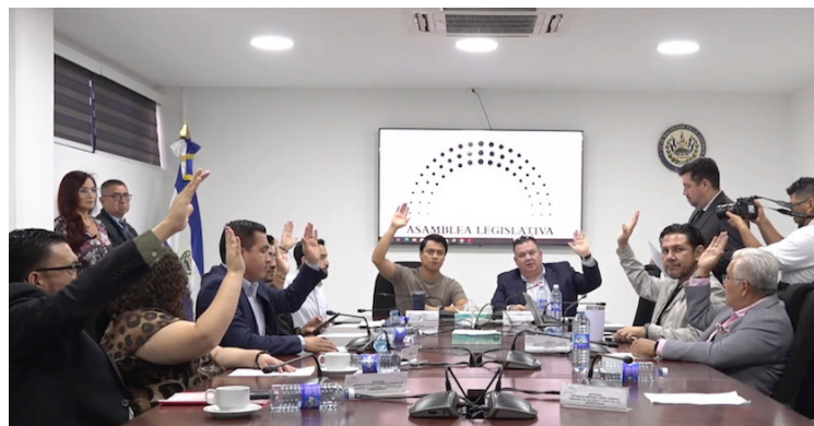
Diputados de la Comisión de Hacienda votan a favor de ratificar dos préstamos para financiar un programa rural.

El préstamo con el Fondo OPEP es a 20 años con 5 años de periodo de gracia. Mientras que el préstamo con el FIDA es por 25 años con un periodo de gra-