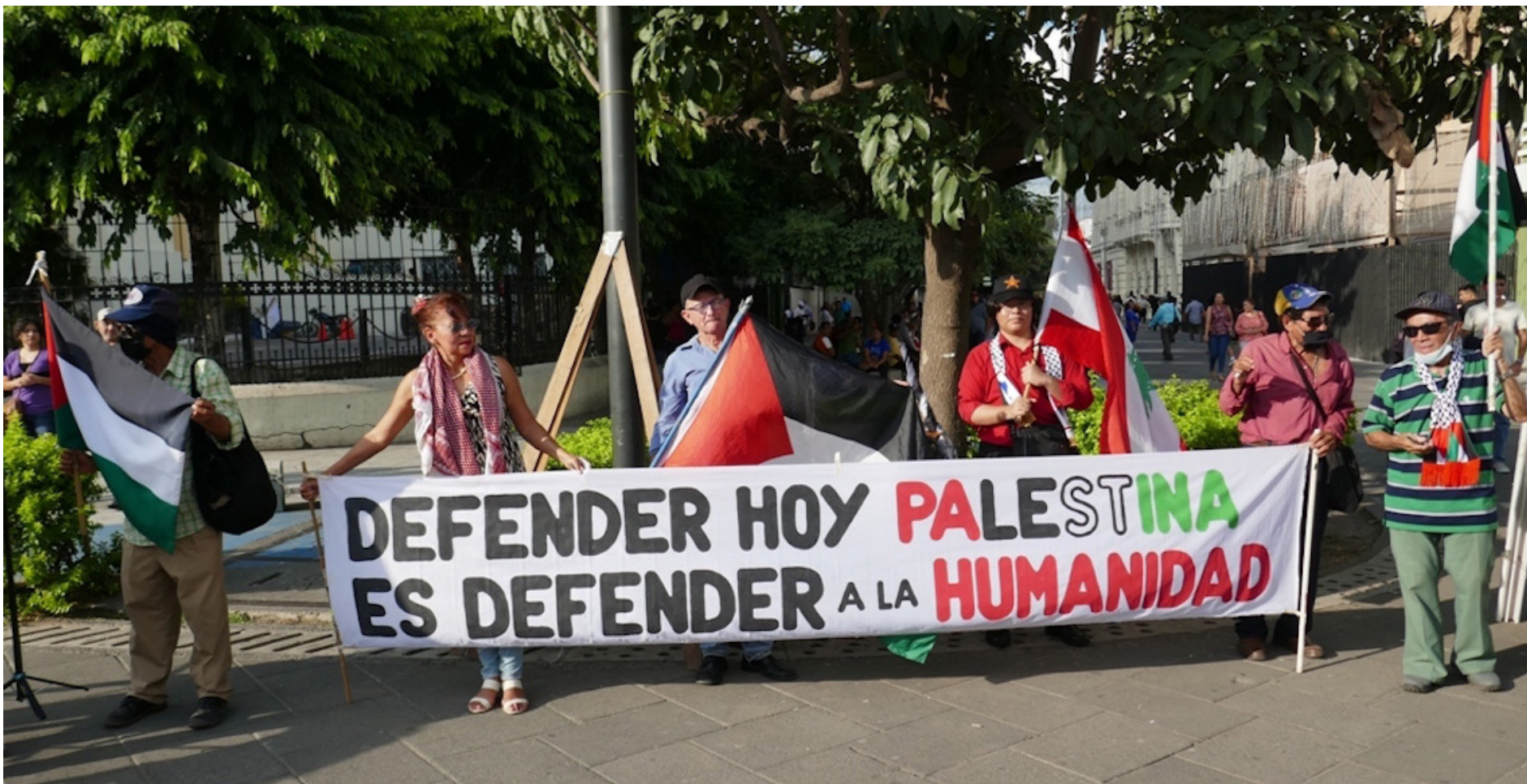
SOLIDARIDAD CON PALESTINA. UNA VEZ, UN COLECTIVO DE SALVADOREÑOS SOLIDARIOS CON LA CAUSA PALESTINA DESARROLLÓ, RECIENTEMENTE, EN EL CENTRO HISTÓRICO DE SAN SALVADOR, UN NUEVO PLANTÓN CON LA PIZARRA DE SOLIDARIDAD CON EL PUEBLO PALESTINO, DONDE ADULTOS Y NIÑOS ESTAMPARON SUS FIRMAS O COLOCARON UN CORAZÓN.