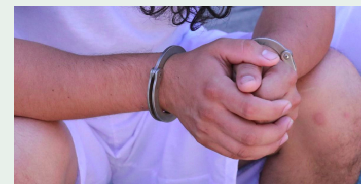
Contador es enviado a juicio por hurto y falsedad contra empresa. El monto supera los $400 mil dólares, según la FGR.