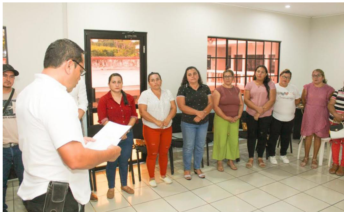
Las ADESCOS son avaladas por la alcaldía municipal; pero con las reformas pasarán a estar bajo el control del CNR.

Las asociaciones comunales y ADESCOS se deberán inscribir obligatoriamente en el Registro de Asociaciones Comunales (RAC) que estaría dentro de un nuevo Registro de Personas Jurídicas (RPJ), la cual se crearía con la Ley de Personas Jurídicas. Dentro del RPJ estaría el Re-