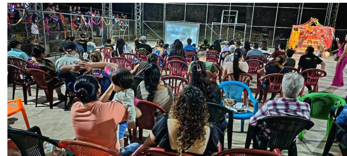
Uno de los momentos más emotivos fue la reproducción del video conmemorativo, elaborado por La Gaceta Suchitoto, un compendio audiovisual que logra reflejar la riqueza de sus vivencias. Foto Diario Co Latino.

Texto y fotos / Luis Rafael Moreira Flores