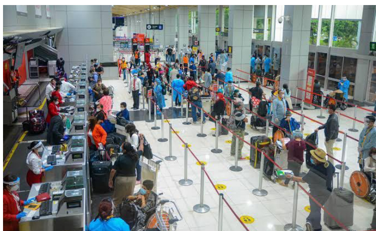
Asamblea Legislativa aprobó que salvadoreños o viajeros que lleguen al país, entre el 1 de diciembre de 2025 y el 31 de enero de 2026, sean beneficiados con una exención de gravámenes al ingresar bienes nuevos por un valor no mayor a $3,000.

Socorro Jurídico Humanitario (SJH) informó recientemente que al menos 462 personas han fallecido en los centros penales, de estos, el 94% no tenían perfil de pandilleros.