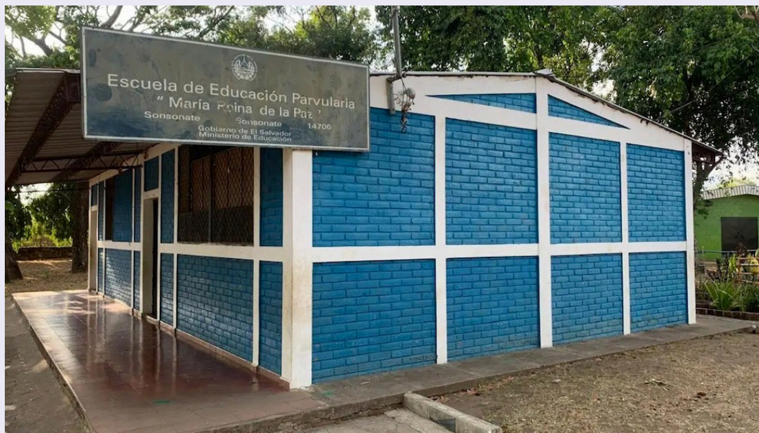
Padres de familia denuncian que el Ministerio de Educación pretende cerrar la Parvularia María Reina de la Paz, en la colonia Las Palmeras, Sonsonate.