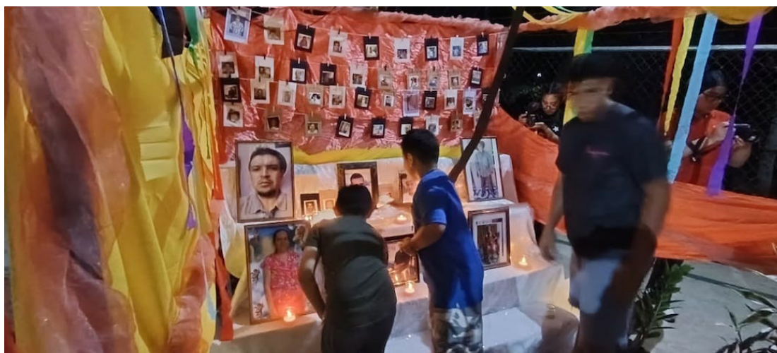
El Papaturro es un capítulo vivo de la memoria histórica del país, un testimonio palpable de la voluntad inquebrantable de la población civil afectada por el conflicto.