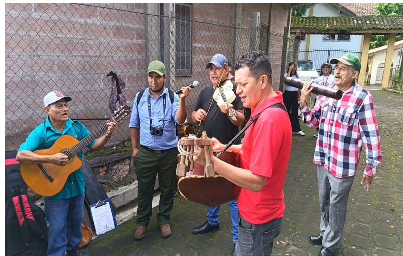
La comunidad El Papaturro entiende que la conmemoración es un acto cultural, donde los grupos musicales no faltaron.