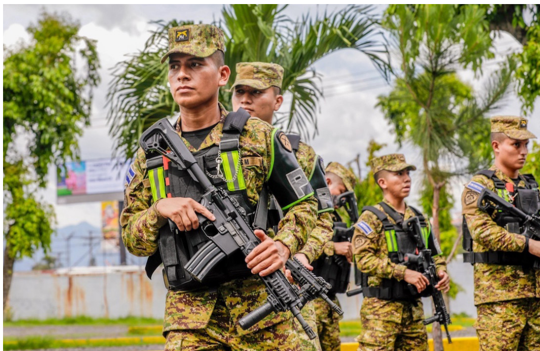
Fuerza Armada de El Salvador realiza labores de seguridad pública en. Gobierno de Bukele, a pesar que esta tarea le compete a la Policía Nacional Civil.