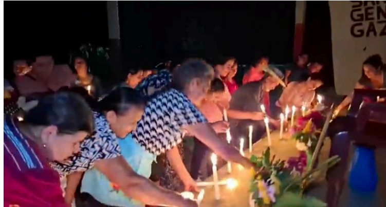
La Comunidad Santa Marta en Cabañas, recuerda los 44 años de los mártires de Santa Cruz y los combatientes de la ofensiva de 1989.

“La desigualdad, represión, la guerra, secuestrados las capturas desaparecidos y asesinados es una realidad dolorosa, es una verdad cruda que todavía duele en la gente. Los gobiernos de ARENA con su lema El Salvador será la tumba donde los rojos terminarán, quisieron sepultar y dejar en el olvido a las víctimas inocentes de las masacres, a los sobrevivientes, desaparecidos y para ello crearon una ley de amnistía que cubría de impunidad los crímenes de lesa humanidad que le llamaron Per-