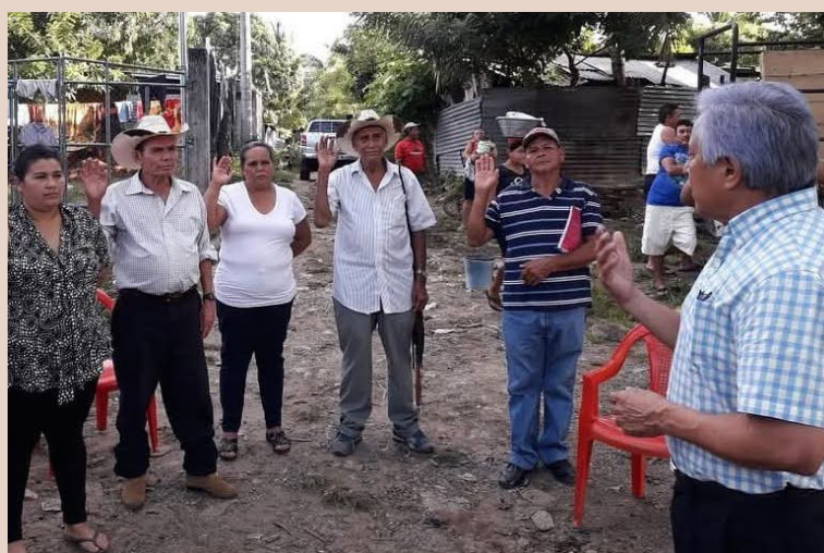
Las municipalidades no podrán inscriban nuevas asociaciones comunales, dependerán directamente del Ejecutivo a través del CNR.

país donde cualquier espacio de organización independiente es visto como una “amenaza”.