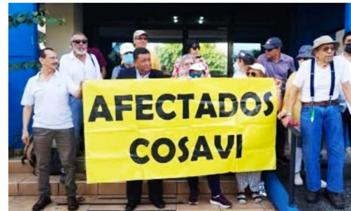
Los afectados de COSAVI denuncian que todavía falta por cumplirle con la entrega de fondos a aproximadamente a 4 mil personas.

Reiteró que ningún afectado está recibiendo interés en los certificados de aportación desde que se hizo público el caso el 9 de mayo de 2024, aunque la Superintendencia del Sistema Financiero (SSF)