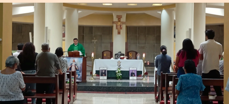
Durante la celebración litúrgica de Cristo Rey, en la Cripta de Catedral Metropolitana, se enfatizó sobre el llamado de la iglesia a la cordura, comprensión y el amor.