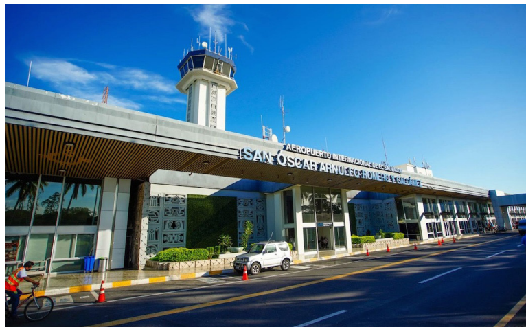
Este préstamo es por $195 millones y se prevé que pase por la Asamblea Legislativa para su aprobación.

El Banco Interamericano de Desarrollo (BID) aprobó un crédito de $195 millones para financiar la modernización del Aeropuerto Internacional de El Salvador, ubicado en Comalapa.