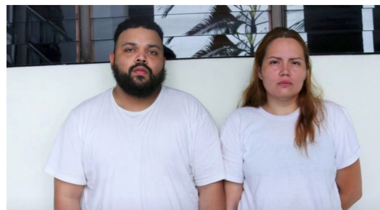
Los imputados son enviados a instrucción como parte del proceso judicial.

La decisión fue tomada luego de que la jueza considerara in-