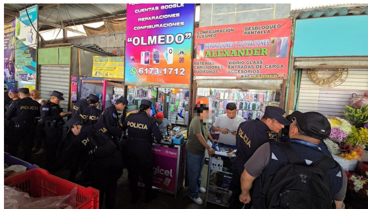
Las autoridades allanan comercios en La Libertad donde presuntamente se venden dispositivos electrónicos.

La Policía Nacional Civil también informó sobre operativos en diferentes puntos del país y enlistó a los detenidos. “Decenas