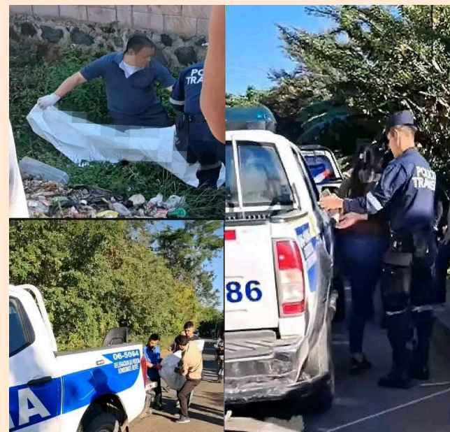
Una conductora fue detenida tras atropellar y causar la muerte de un padre y sus dos hijos en el cantón Morro Grande, carretera de Guaymango hacia Acajutla.

Otras dos personas resultaron lesionadas tras colisionar un sedán con un furgón estacionado en el kilómetro 115 de la carre-