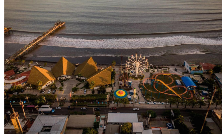
Los préstamos totalizan $135 millones para financiar el proyecto Surf City Fase II. Estos créditos serán pagados en 20 años.

Será el Ministerio de Obras Públicas y Transporte la encargada de ejecutar el proyecto, que se llevará a cabo a través de varios componentes. La primera fase consiste en la elaboración de los estudios técnicos y los diseños de ingeniería para la construcción de la red de alcantarillado, plantas de tratamiento de aguas resi-