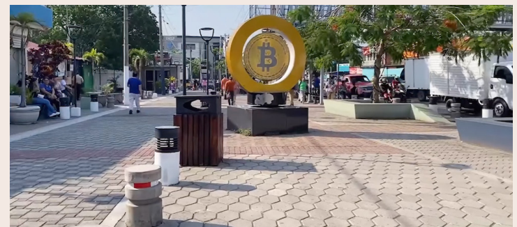
El Gobierno compra mil monedas bitcoin por $100 millones a pesar que el FMI le ordenó no destinar fondos públicos para este fin.

El Gobierno desobedece al FMI al comprar periódicamente monedas bitcoins. El FMI le dijo claramente que no empleara fondos públicos para este fin. La oficina Bitcoin compró este 18 de noviembre un bitcoin más, apar-