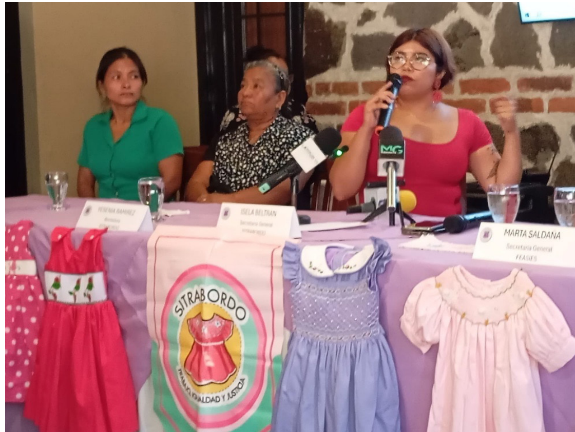
El Sindicato de Trabajadoras de Bordado a Domicilio de El Salvador (@SSitrabordo) da a conocer los resultados de un diagnóstico, que evidencia la precariedad y vulnerabilidad de quienes se dedican al bordado a mano para la industria textil en el país.

Enfatizó que en su caso no ha optado por otro trabajo porque tiene dos hijos pequeños, no tiene quién los cuide y no se siente segura de dejarlos con otra persona, sin embargo, el dinero no