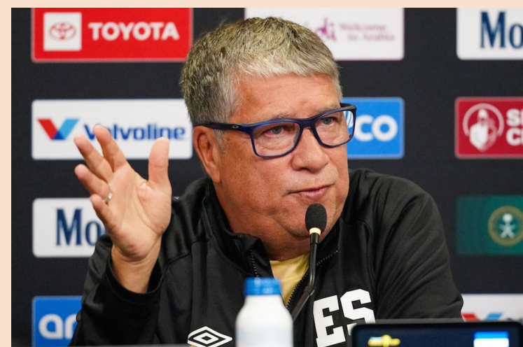
El técnico de La Selecta se ve involucrado en un altercado con aficionado que cuestionó resultado ante Panamá en el cierre de las eliminatorias de Conca-caf.

Tales incidentes sucedieron luego de la derrota de 3-0, que Panamá propinó a El Salvador, y porque al “Bolillo” se le vio “muy sonriente”. Además, luego del pitido final, el técnico muy alegre se unió en abrazos con los jugadores de la selección canalera, algo que la afición catalogó como “falta de respeto”, y algunos solicitaron que se desvincule al técnico de La Selecta.