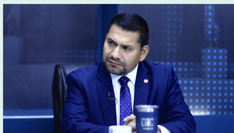
El diputado del partido ARENA Francisco Lira critica las acciones legislativas. Foto Diario Co Latino/Cortesía.