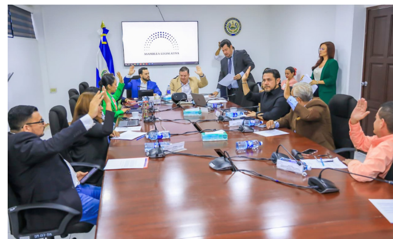
Comisión de Hacienda emite dictamen para reforzar presupuestariamente a diversas instituciones del Estado.

millones; Ramo de Educación, Ciencia y Tecnología, $116 millones; Ramo de Salud, $38,730,000; Ramo de Trabajo y Previsión Social, $1,100,000; Ramo de Cultura $3.8 millones; Ramo de Agricultura y Ganadería $20 millones; Ramo de Obras Públicas y de Transporte, $57.5 millones y el Ramo de Turismo por $4,130,000. En mayo de 2024, se autorizó al Gobierno la gestión de recursos por $1,500 millones, a través de la emisión o ejecución de Títulos Valores de Crédito, otros tipo de instrumentos financieros y/o combinación de los mismos, incluyendo operaciones de manejo de pasivos. Estos fondos que se obtengan, “se destina-