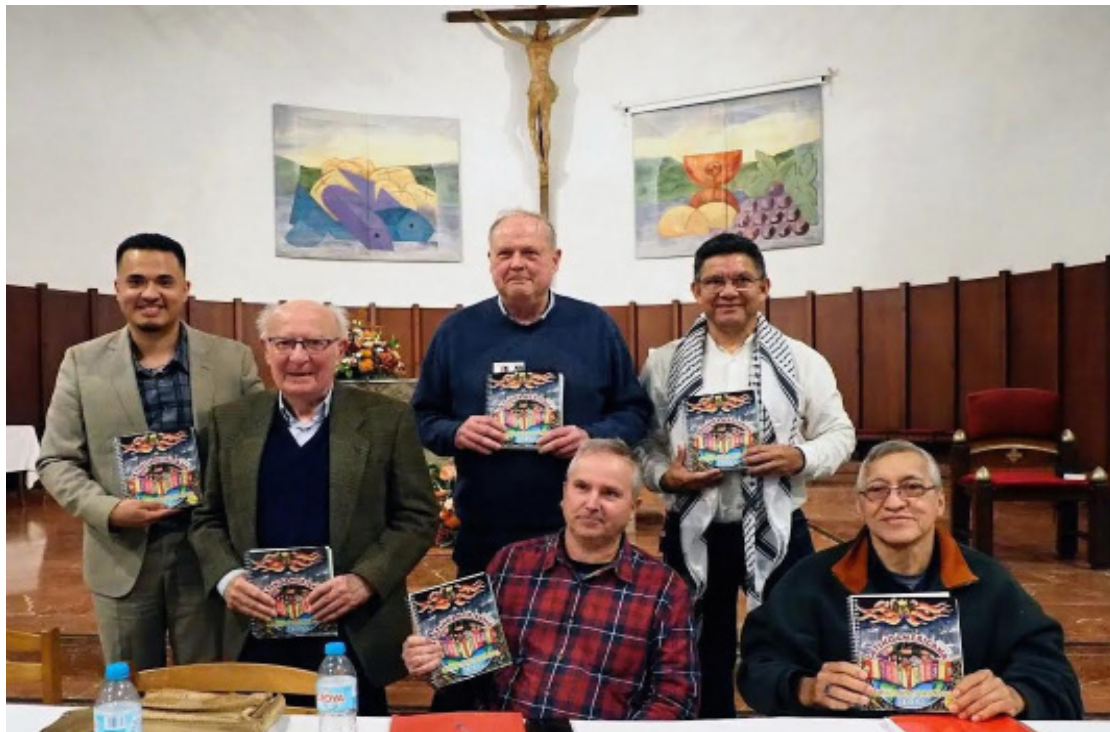
UNIDEHC expuso en Cataluña, España, las graves violaciones de derechos humanos que comete actualmente el gobierno salvadoreño.

En el evento se tuvo la participación de otros ponentes de la Universidad Centroamérica José Simeón Cañas (UCA) de El Sal-