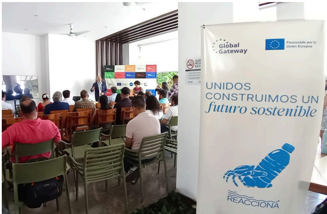
El proyecto "Reaccioná" pretende que hoteles y restaurantes del sector turístico de La Libertad y Sonsonate puedan reducir impactos ambientales.