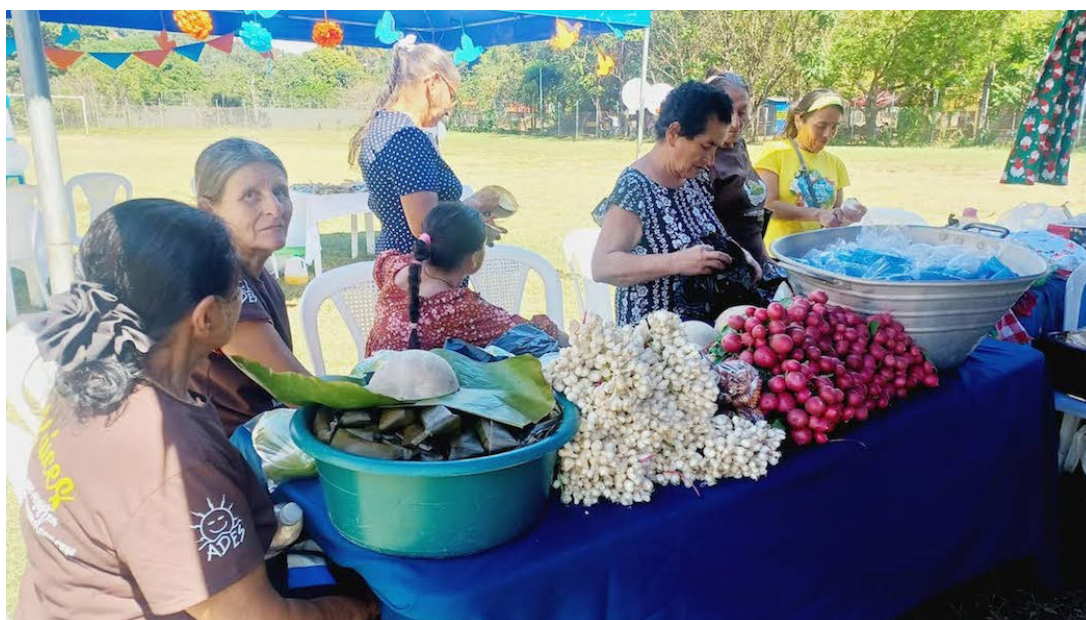
ADES Santa Marta busca que las voces de las juventudes sean escuchadas en los territorios de Cabañas y otros departamentos.

Como parte del proyecto, ADES también desarrolla talleres artísticos y formativos con jóvenes de Suchitoto y comunidades históricas como Selena Ramos, Papaturro y Copapayo, que comparten con Santa Marta un fuerte vínculo con la memoria histórica.