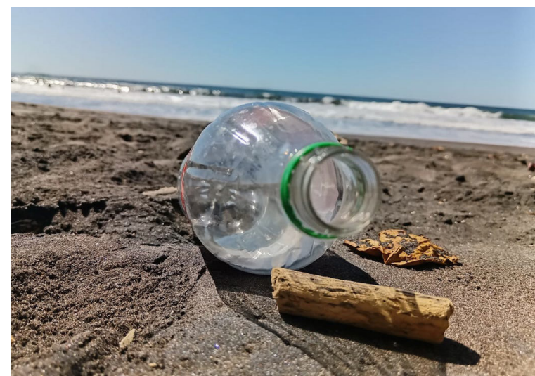
El proyecto dirigido a hoteles y restaurantes de la playa pretende generar puntos, donde llevar los plásticos que puedan servir a otros sectores.

El objetivo es acompañar a las empresas desde el inicio, escuchar sus necesidades y facilitar un proceso que sea útil, práctico y ajustado a la realidad del sector empresarial en los territorios.