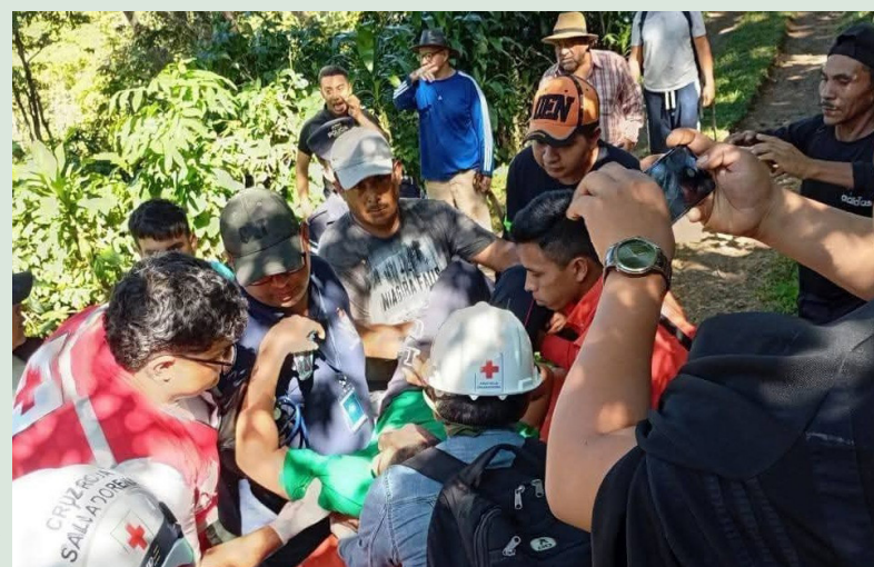
El menor de edad fue estabilizado por socorristas de Cruz Roja Salvadoreña y posteriormente trasladado a un centro asistencial.

Como parte del operativo, se desplegó apoyo aéreo que sobre-