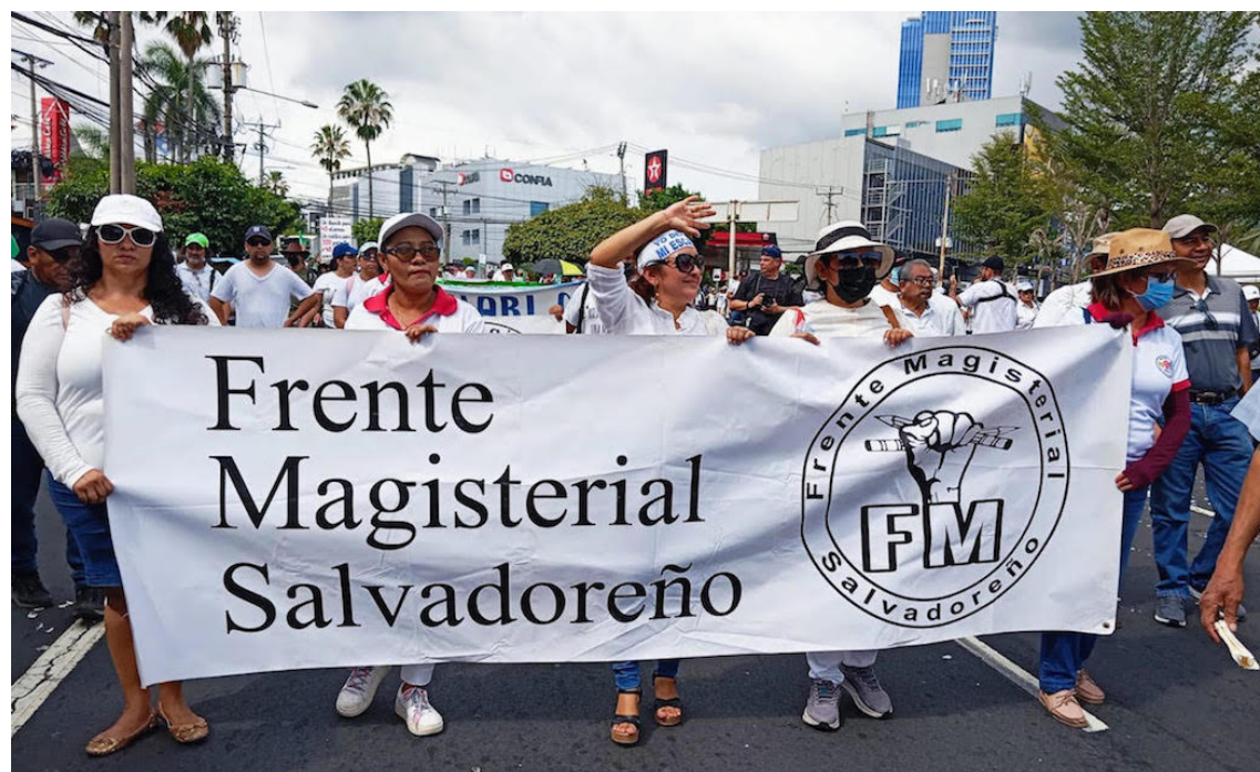
Se registra una deserción escolar de 146,378 niños, niñas y adolescentes entre 4 y 17 años.

modalidad que el gremio califica como trabajo forzado. De haberse contratado personal especializado, el costo reconocido en el mercado sería de aproximadamente 450 dólares.