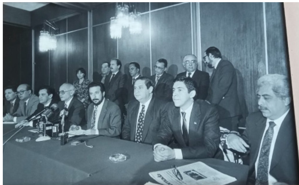
Primera reunión de COPAZ, el 10 octubre de 1991, México.

Explicar y razonar el origen y perfil de cada representación daría para un extenso artículo. Los primeros tanteos y forcejeos fueron sobre la participación de Naciones Unidas y el Arzobispado. Un bando se oponía rotundamente, el otro lo favorecía. Se transó por no aceptarlos hasta la aprobación de la ley de creación de COPAZ. Ese