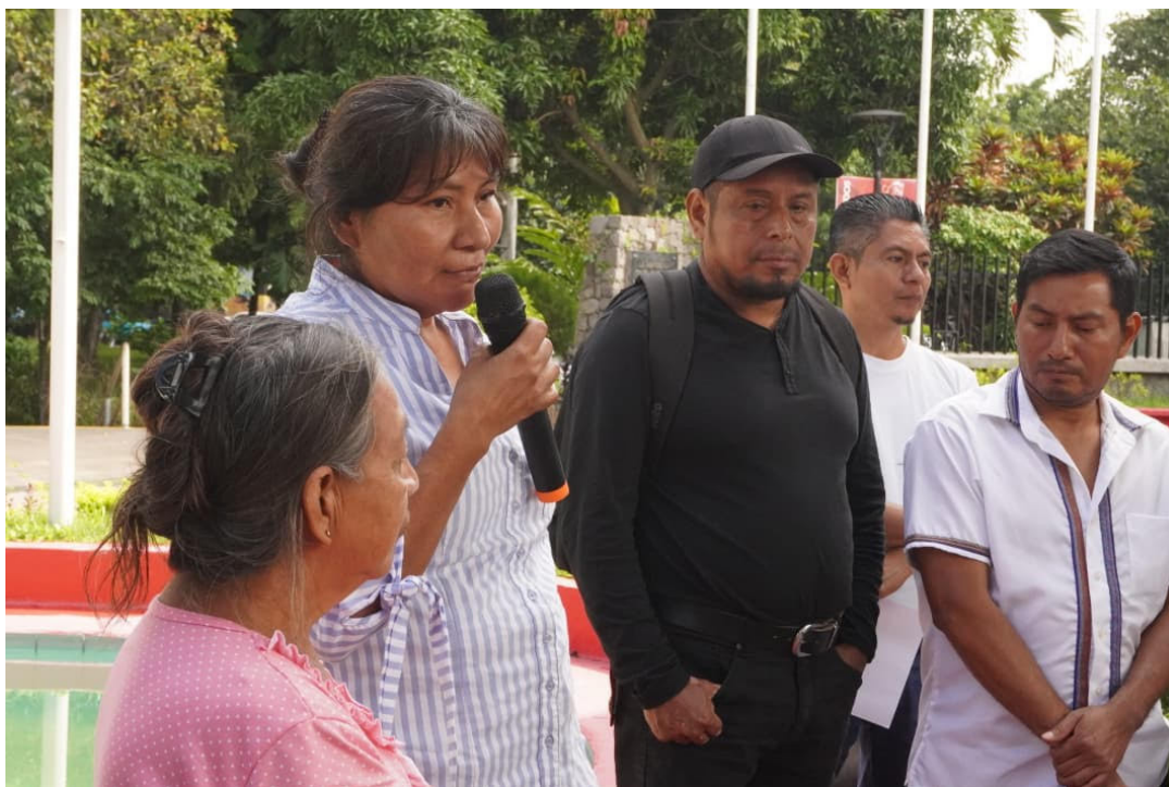
El Comité Indígena para la Defensa de los Bienes Naturales de Nahuizalco expone la situación que viven en diferentes comunidades de Sonsonate ante la amenaza de una octava represa hidroeléctrica.