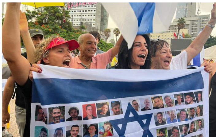
Familiares y amigos de rehenes israelíes festejan el acuerdo de alto el fuego en Gaza, en Tel Aviv, Israel, el 9 de octubre de 2025.

El gabinete de seguridad se reunió en la noche antes de una sesión del gabinete completo para votar sobre la primera etapa del plan de paz de 20 puntos apoyado por Estados Unidos, dijo a Xinhua un funcionario con la condición de no ser identificado. De acuerdo con el funcionario, la tregua entrará en vigor una vez que las votaciones concluyan. En un plazo de 24 horas, el ejército israelí llevará a cabo una retirada inicial a la llamada “línea amarilla”, una referencia a un mapa de cese al fuego publicado el mes pasado por la Casa Blanca que describe múltiples etapas de retirada. Israel también permitirá la entrada de ayuda humanitaria a la Franja de Gaza, agregó el funcionario. De conformidad con el acuerdo, Hamas regresará a 20 rehenes que se cree que todavía están vivos y entregará los cuerpos de otros 28. A cambio, Israel liberará reos palestinos. La lista incluye a cerca de 270 prisioneros condenados por varios cargos, incluyendo ataques contra israelíes, así como alrededor de 1.700 resi-