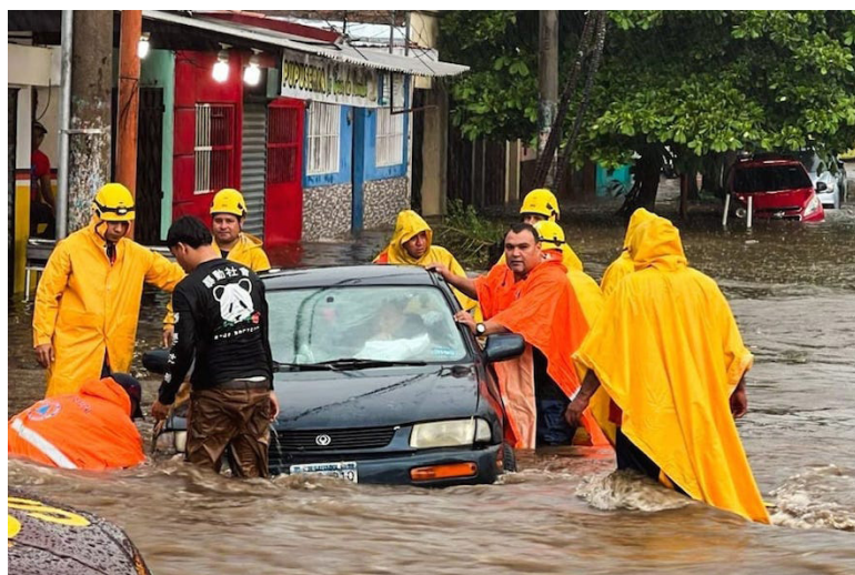
Las lluvias sorprendieron a los salvadoreños la tarde de este jueves, las autoridades piden a la población tomar medidas de protección.

Las calles del redondel que conduce hacia Los Naranjos, en Santa Ana, también resultaron inundadas, debido a las intensas lluvias; igual situación