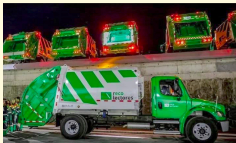
Diputados a favor de que ANDRES defina las tarifas por el servicio prestado a la población con respecto a la disposición final de los desechos sólidos.

Por ello, instó a los gobiernos de la comunidad internacional a ser “coherentes” con el derecho a la vida, a la soberanía y la autodeterminación de los pueblos y adopten medidas prácticas para contrarrestar “esa política genocida y guerrillera que causa sufrimiento y desestabilización”.