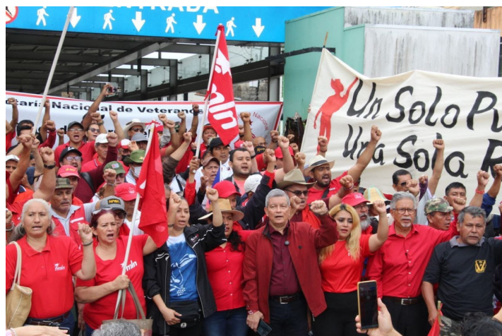
El FMLN condena el bloqueo de Estados Unidos en contra de Cuba, el cual ya tiene más de 60 años.

Es de recordar que Estados Unidos mantiene un