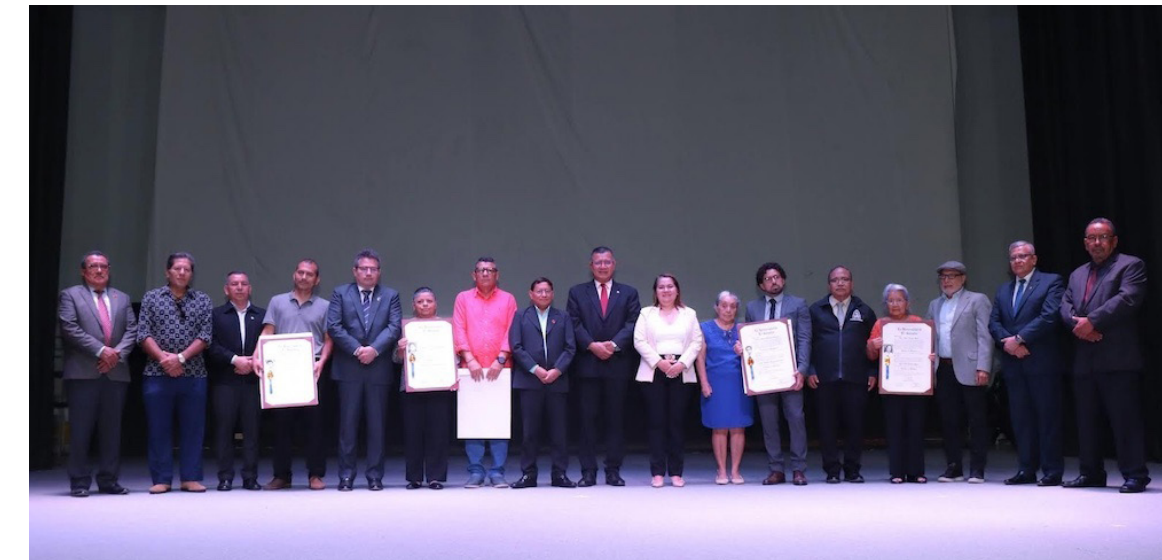
En reconocimiento a su legado, la UES estableció el 28 de octubre como la fecha oficial de toma de posesión de las autoridades universitarias y durante el acto conmemorativo, se entregó títulos honoríficos póstumos a a quienes defendieron la libertad académica.

“Todos conocemos el saldo de dicha ocupación: muertos, heridos y desaparecidos. El dolor y el luto que nos embarga lo compartimos con las familias de las víctimas. Nunca en nuestro continente la barbarie se había ensañado tanto contra la cultura... Quemar libros fue la herencia