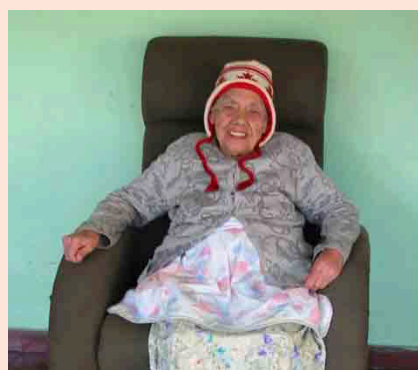
El Grupo Scout #1 “Los Intrépidos” busca mejorar las condiciones de vida de cerca de 90 adultos mayores del Hogar San Vicente de Paúl.

Entre los productos que recolectará el Grupo Scout #1 se encuentran: toallitas húmedas, pañales talla L para adul-