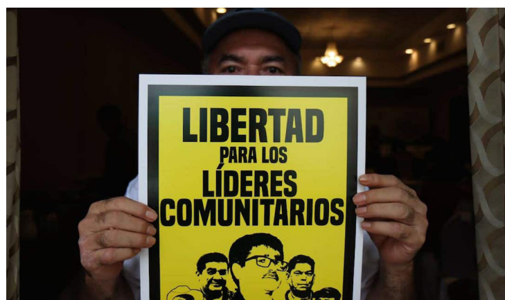
El caso de los ambientalistas ha mostrado irregularidades por parte de la Fiscalía General de la República (FGR).

El 24 de septiembre pasado, el Tribunal de San Vicente emitió un fallo oral que absolvió a ocho personas, entre ellas los cinco ambientalistas de Santa Marta, de los cargos de homicidio relacionados con hechos ocurridos durante el conflicto