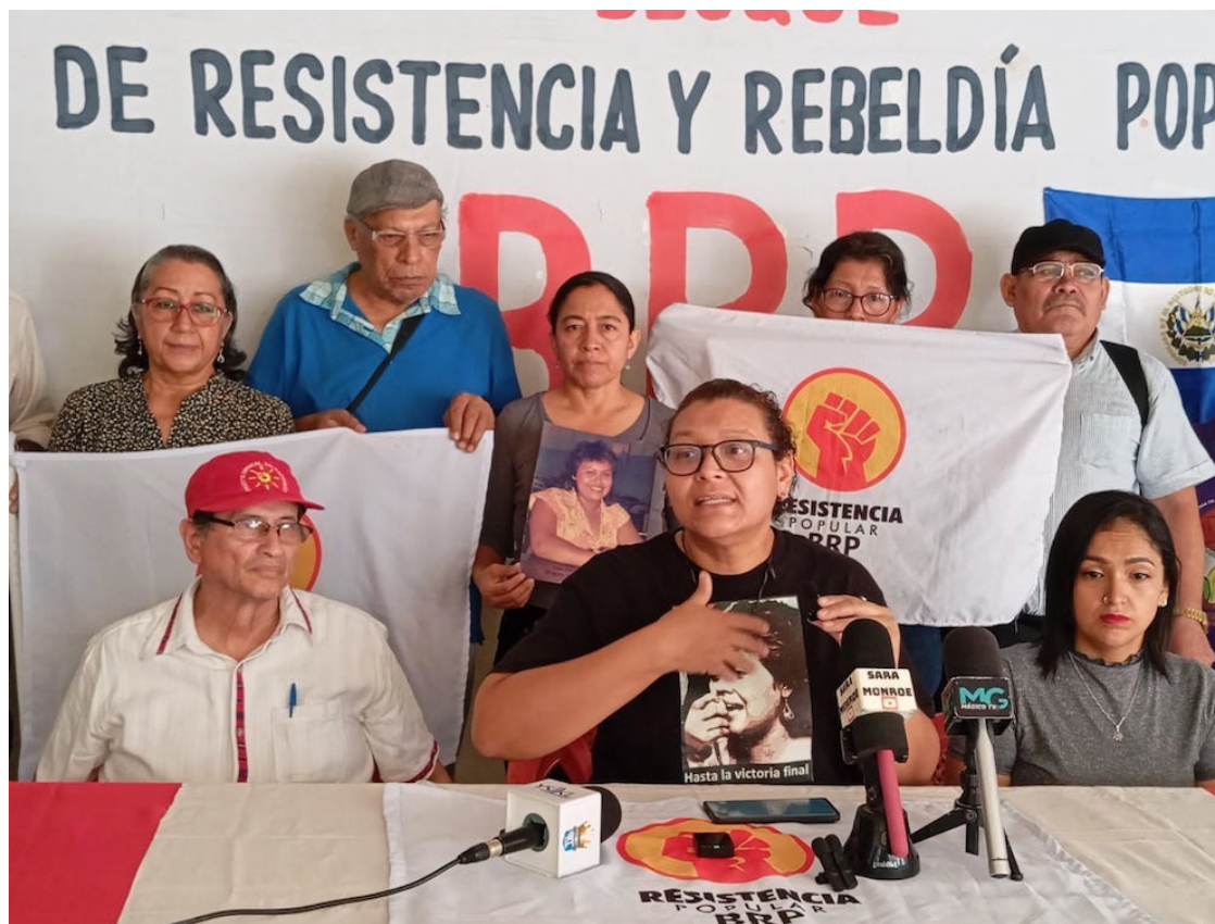
El BRP considera que las instituciones laborales se han sometido al control político del Ejecutivo, dejando sin voz ni amparo a miles de trabajadores del sector público y privado.

“En el país se ha profundizado la precarización laboral, la falta de estabilidad en el empleo público, la desigualdad salarial y la represión contra quienes defienden los derechos de los trabajadores”