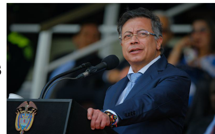
Imagen proveída por la Presidencia de Colombia del presidente colombiano, Gustavo Petro. (Xinhua/Ovidio González/Presidencia de Colombia)

Con este hecho escala aún más el conflicto diplomático entre Colombia y Estados Unidos, luego de que el presidente Petro exigiera al Gobierno de Trump frenar sus bombardeos en aguas cercanas a Colombia y entregar la lista de los muertos en estas ope-