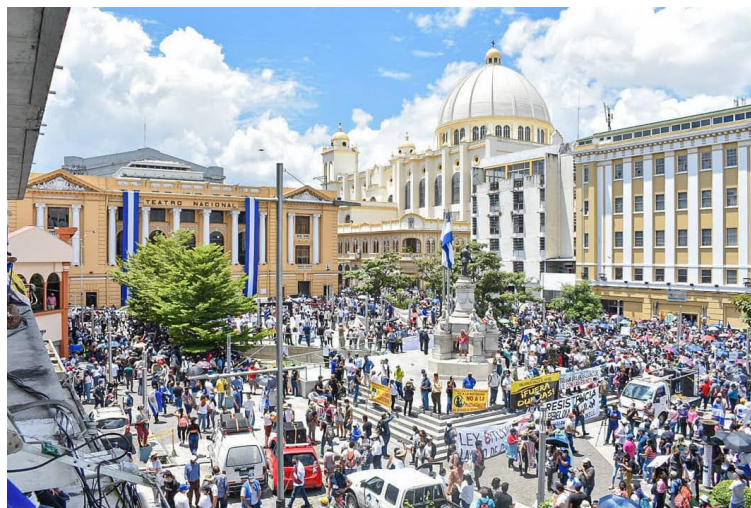
El 15 de septiembre de 2021, miles de salvadoreños marcharon por las calles de San Salvador en contra de las políticas del actual Gobierno, desde entonces el Gobierno ha incrementado la persecución contra líderes sociales, entre ellos contra los miembros de la Alianza Nacional El Salvador en Paz.