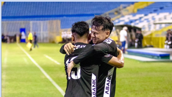
Jugadores del Club Deportivo Hércules celebran el gol que les dio el triunfo sobre el Alianza.