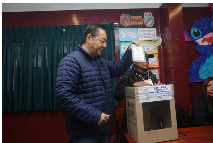
El presidente boliviano, Luis Arce, deposita su voto en un colegio electoral, en la ciudad de La Paz, Bolivia, el 19 de octubre de 2025.

Rodeado de periodistas, el mandatario boliviano instó a los ciudadanos a acudir de forma copiosa a las urnas y a respetar “absolutamente”