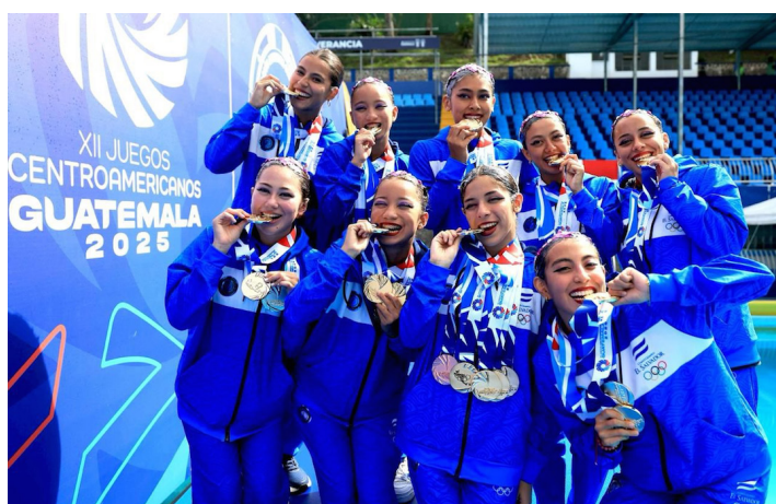
Seleccionadas nacionales de natación artística, posan con sus medallas luego de su participación en los XII Juegos Centroamericanos Guatemala 2025.

El Salvador continúa en su escalada a las primeras posiciones del medallero de Guatemala 2025 y hasta el cierre de esta nota, se posicionaba en la casilla 4, con 9 oros, 8 platas y 15 bronce, con el total de 32 pre-