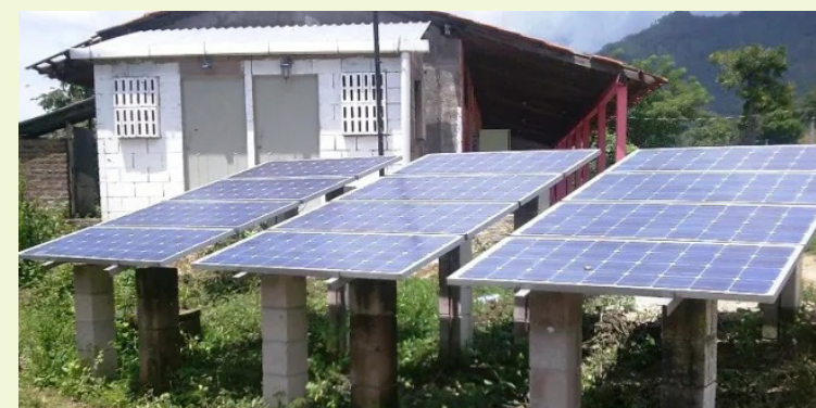
Por un periodo de 10 años, la importación, la comercialización, la instalación y el mantenimiento de sistemas de generación de energía con fuentes renovables se eximirá de todo impuesto, como la renta, el IVA y el DAI.

También tendrán derecho de deducirse de su renta gravable lo que gasten en la respectiva compra e instalación para el ejercicio o período impositivo en el que realicen la operación. Para la comprobación de la deducción, el usuario final deberá anexar el documento tributario que le extienda el proveedor beneficiado al momento de la compra del equipo o de la instalación del mismo. Para regir un marco contralor, la Superintendencia General de Electricidad y Telecomunicaciones (SIGET) será la que regulará los requisitos y procedimientos que deberán cumplir