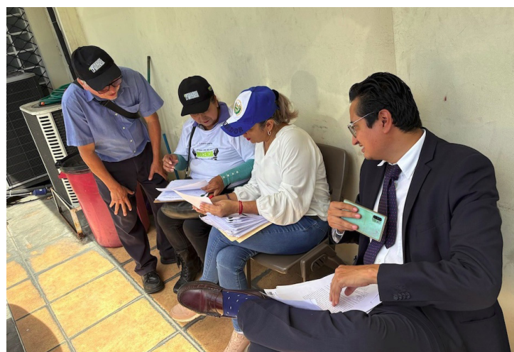
A pesar de que no fueron recibidos por la titular de esta institución, MOVIR ordena los casos según el protocolo de la PDDH para darles ingreso.

El pasado 15 de octubre, la Asamblea reeligió a Raquel Caballero de Guevara para procuradora de DDHH, siendo su tercer periodo: 2016-2019, 2022-2025 y 2025-2028. Todo su periodo anterior estuvo expectante del régimen de excepción pero no hubo pronunciamientos en contra de las violaciones a derechos humanos; el trabajo fue poco o nulo con respecto a este tema.