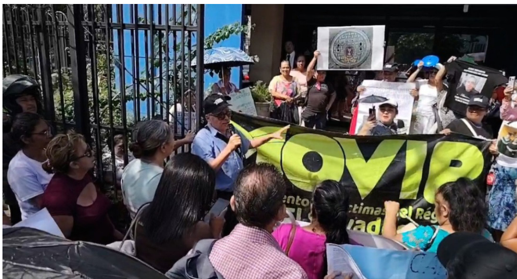
Movimiento de Víctimas del Régimen (MOVIR) se presenta a la PDDH para presentar más casos de detenciones arbitrarias bajo el régimen de excepción.