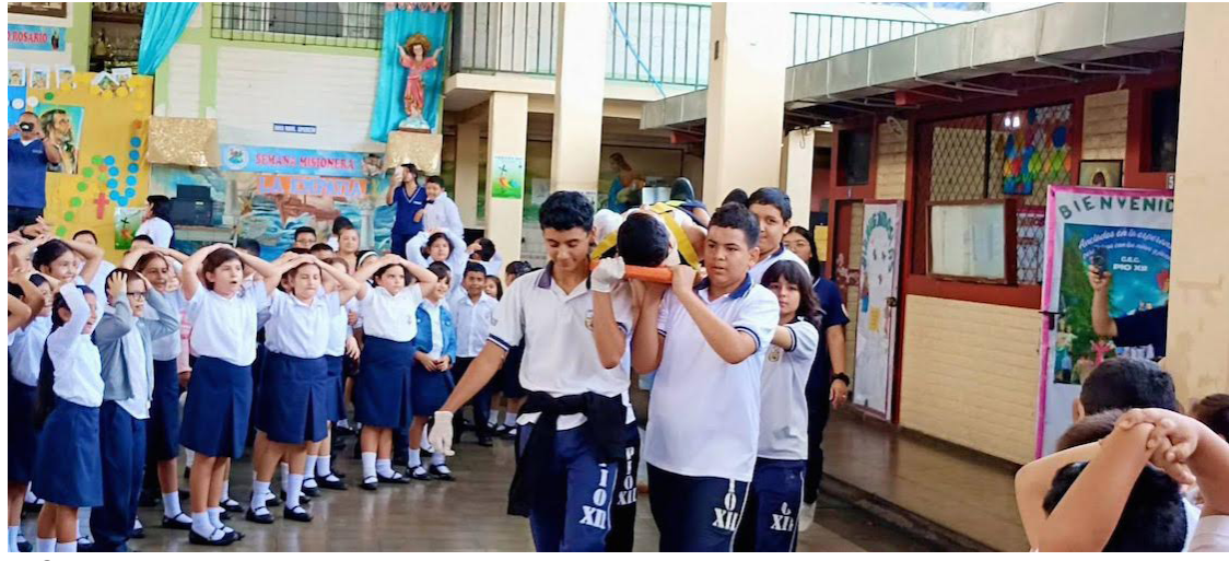
El Salvador se encuentra en una de las zonas tectónicas más activas del mundo, debido a la interacción entre las placas de Cocos y del Caribe.

Salvador demuestra que los terremotos en la región provocan un alto número de pérdidas humanas, daños estructurales severos y afectaciones socioeconómicas significativas. Por este motivo, la preparación nacional resulta esencial, señalaron autoridades de Protección Civil.