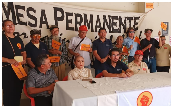
Organizaciones sindicales y sociales convocan este 31 de octubre, a una concentración a las 8 de la mañana en el Parque Cuscatlán, San Salvador, para conmemorar el Día del Sindicalista.

Méndez dijo que en ese momento las organizaciones sindicales sufrían la más bestial represión por parte del “gobierno de ultraderecha” de Alfredo Cristiani y la casta militar de turno, la captura, asesinato y desaparición de los dirigentes y bases sindicales muestra