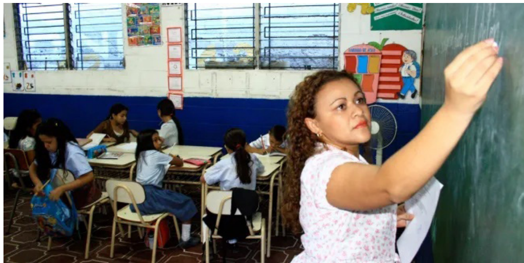
Diputados aprueban un empréstito de $150 millones entre El Salvador y el Banco Interamericano de Desarrollo, para financiar un programa educativo enfocado en ampliar la cobertura y calidad escolar.

El plan también contempla la ampliación de cupos desde parvularia hasta bachillerato, el fortalecimiento institucional ante emergencias climáticas y la mejora en los procesos de enseñanza-aprendizaje, mediante la capacitación docente y el uso de metodologías adaptadas a las necesidades del alumnado.