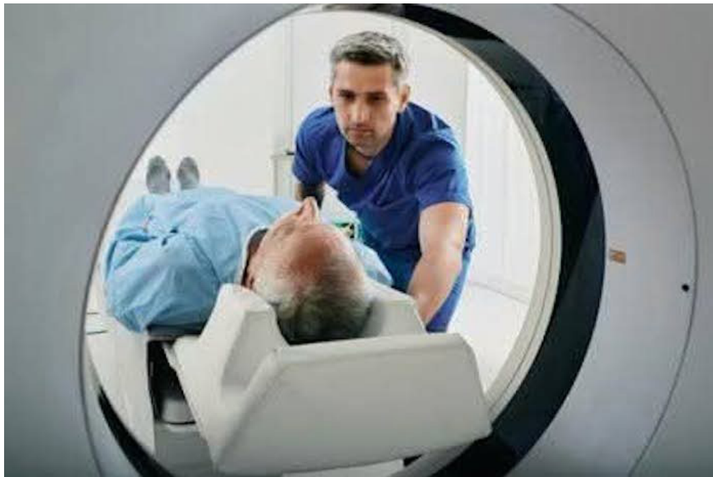
Bases Magisteriales denuncia que en las clínicas del ISBM no hay capacidad para cubrir la demanda de estudios radiológicos, rayos X, ultrasonografías, entre otros.