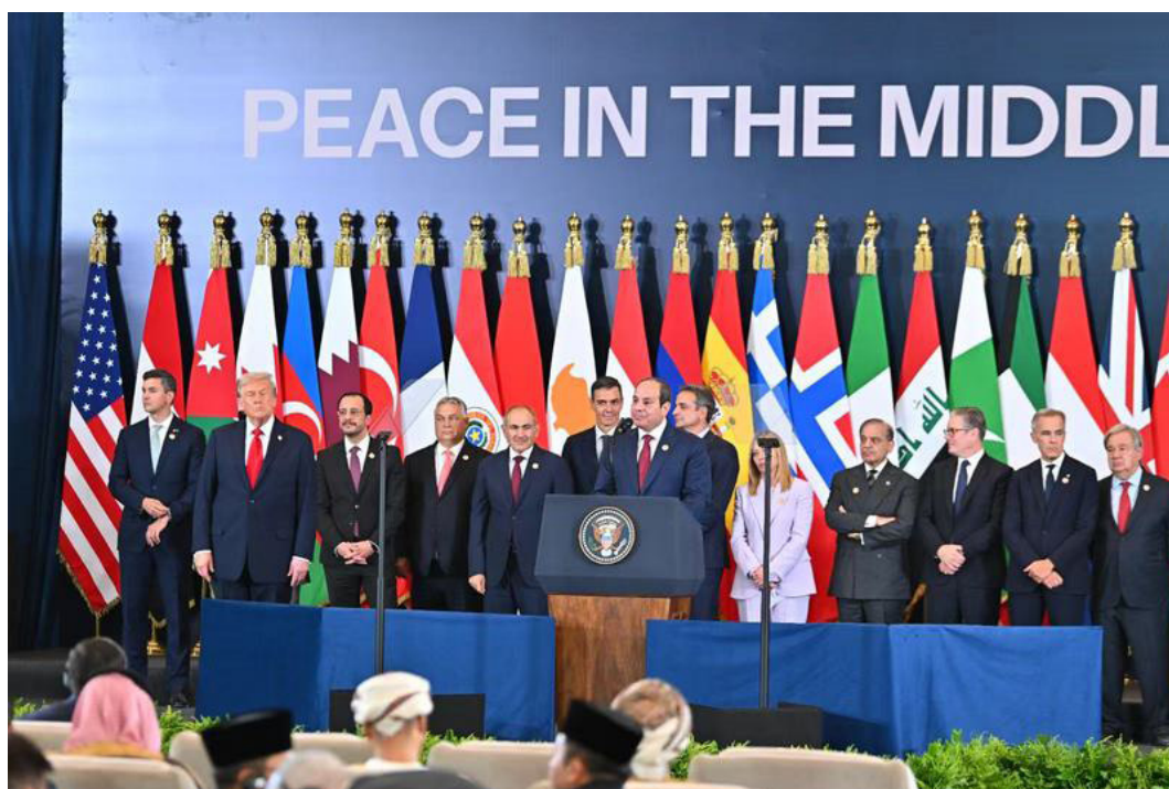
El presidente egipcio, Abdel Fattah al-Sisi (c), habla en la cumbre sobre la finalización de la guerra en Gaza, en Sharm el-Sheikh, Egipto, el 13 de octubre de 2025.

La entrega tuvo lugar un día después de que Hamas liberara con vida a 20 cautivos israelíes y cuatro de los 28 cadáveres retenidos en Gaza en virtud de un acuerdo de alto al fuego e intercambio de prisioneros mediado por Estados Unidos, Egipto, Qatar y Turquía luego de dos años de guerra.