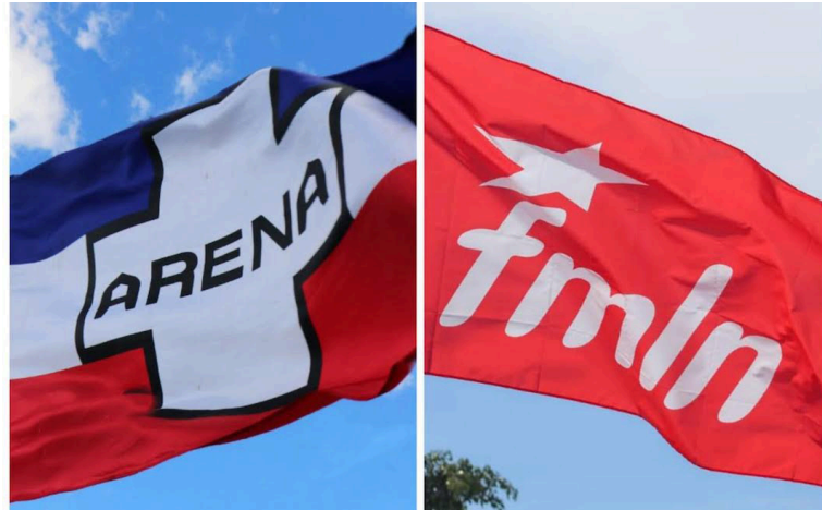
ARENA y FMLN son partidos históricos que por 30 años, tras los Acuerdos de Paz dominaron el espectro político de El Salvador.