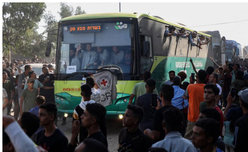
Imagen de personas dando la bienvenida a presos palestinos liberados en el Complejo Médico Nasser, en el sur de la ciudad de Khan Younis.