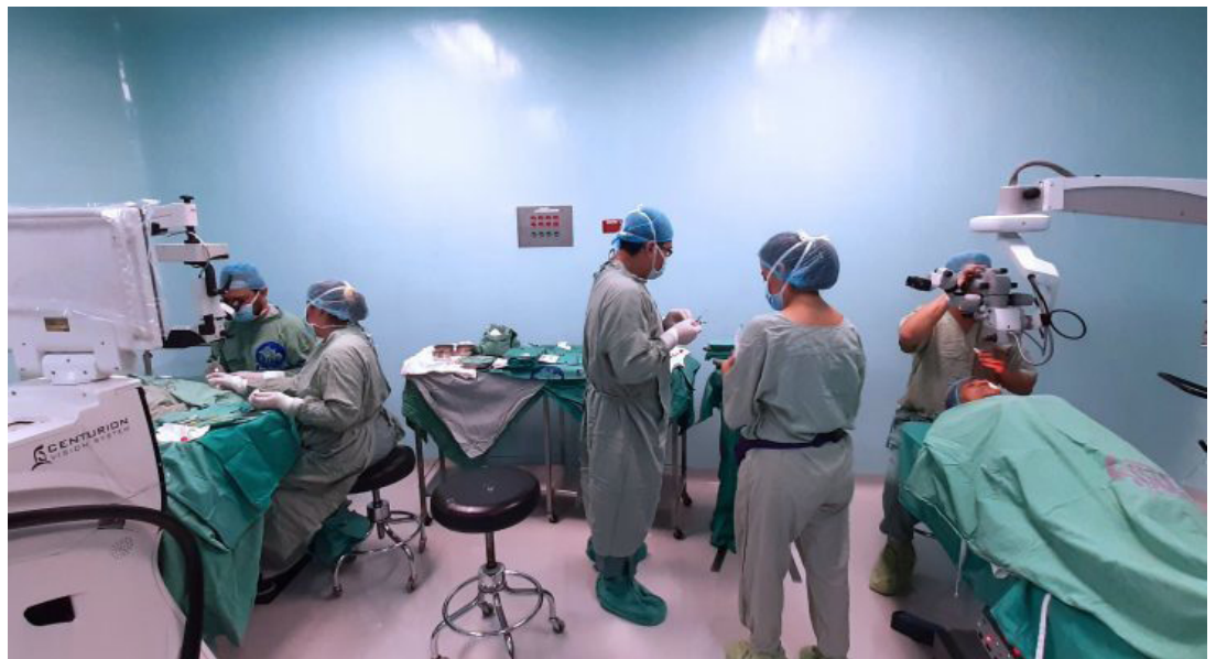
El Colegio Médico recomienda a los cirujanos negarse a entrar a una sala de operaciones bajo condiciones inadecuadas, porque someten al paciente a adquirir una infección.

ta de recursos, incumplimiento de protocolos de prevención por parte del personal médico, uso inadecuado de los antibióticos, entre otras, puede ser algunos de los factores de las bacterias o infecciones intrahospitalarias.