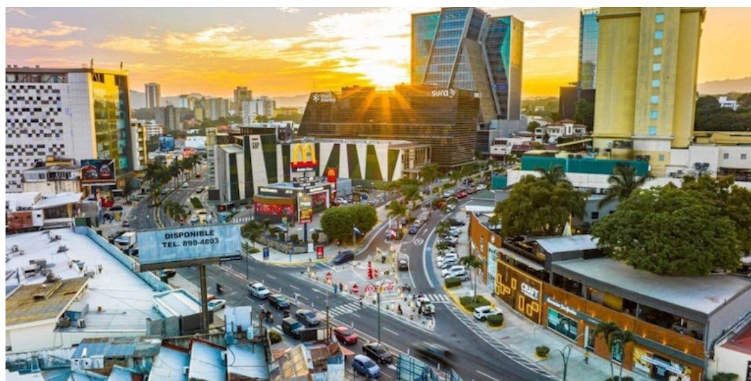
Esta iniciativa, la cual, tiene como propósito posicionar al país como un destino atractivo para inversiones sofisticadas, fortalecer el ecosistema financiero y promover el crecimiento económico, pasará al pleno legislativo este miércoles en la sesión plenaria ordinaria.

Añadió que el nuevo marco legal está orientado a dar certeza jurídica a los inversionistas sofisticados, es decir, aquella