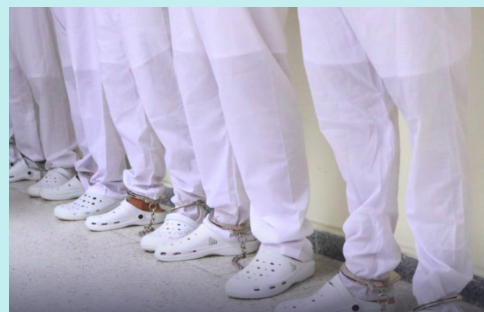
El juzgado evaluó la oferta probatoria y, tras identificar elementos relevantes y pertinentes, ordenó la apertura a juicio, ratificando la detención provisional para los seis procesados.

De acuerdo con el requerimiento fiscal, el imputado fue capturado en flagrancia el 2 de