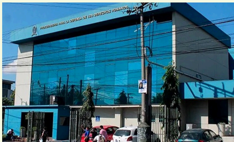
El Equipo Regional de Monitoreo y Análisis de Derechos Humanos considera que en la elección del titular de la PDDH no ha garantizado la independencia e idoneidad de los candidatos.

La PDDH es una institución clave para salvaguardar la dignidad humana y velar por los derechos humanos de las víctimas de abusos por parte del Estado, así como de otros sectores.