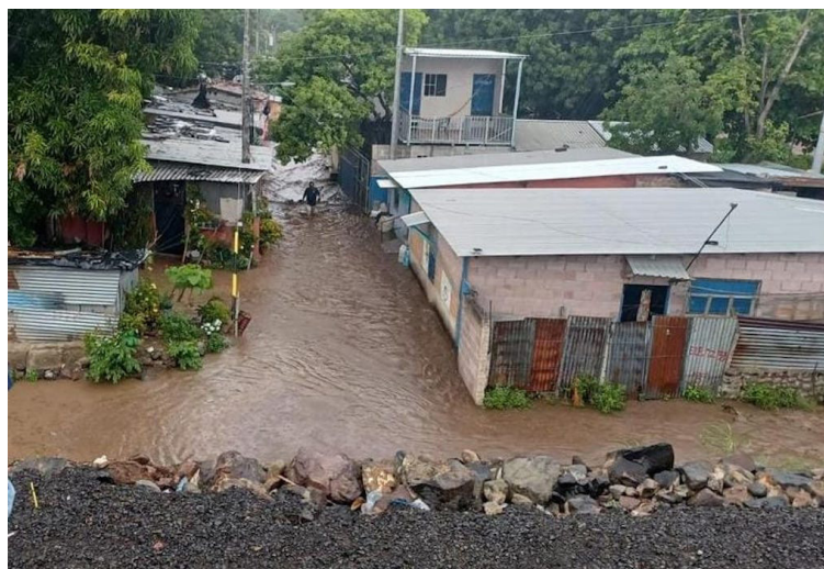
Luego de las recientes lluvia en el país, el río Chilama en La Libertad, se desbordó.

“Al tener demasiada agua acumulada en los suelos, existe una alta probabilidad de incidentes como deslaves o deslizamientos, en la zona costera pedimos a la población que acate todas las medidas de prevención, debido a las corrientes de arrastre que pueden generarse por las lluvias tipo temporal que estamos registrando”, sostuvo López.