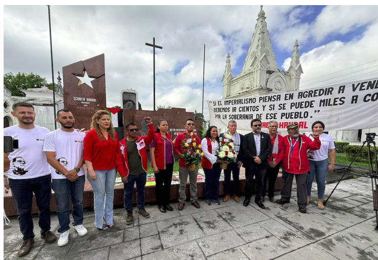
Hándal fue un líder histórico del FMLN y del movimiento de izquierda en El Salvador. Su lucha por una democracia genuina sigue siendo el objetivo de la sociedad.

El FMLN informó que a partir de este año, el natalicio de Hándal se celebrará de manera oficial, así fue declarado por el Consejo Nacional del partido.