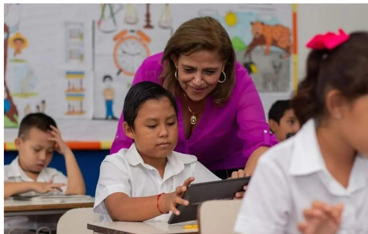
El Ministerio de Educación suspendió las clases a escala nacional obligatorio para el sector público por el aumento de las precipitaciones en todo el territorio y la saturación de suelos.

El Cuerpo de Bomberos llevó a cabo un monitoreo preventivo en la parte alta de la quebrada El Piro, Antiguo Cuscatlán, La Libertad, sin embargo, el caudal se mantiene moderado pese a la llovizna constante; Protección Civil desarrolló labores de limpieza en la colonia Médica, así como la 39 Avenida Norte y bulevar Universitario, San Salvador.