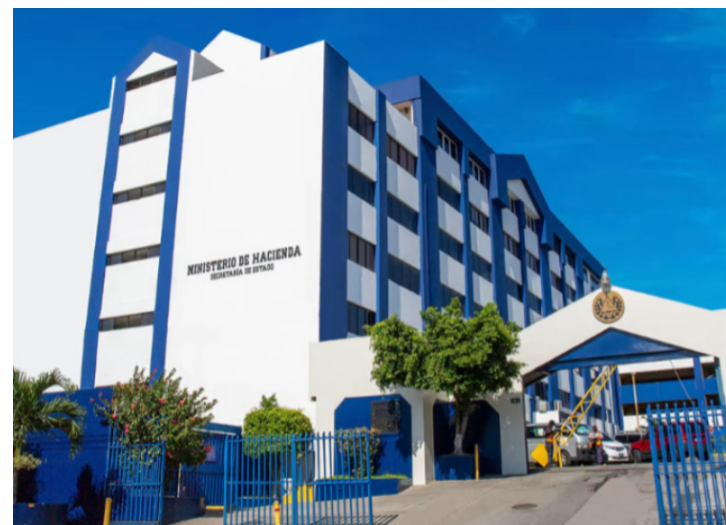
Nuevamente, Hacienda promoverá una Ley de Amnistía Fiscal que estará vigente por 60 días tras su publicación en el Diario Oficial.

De acuerdo a lo expuesto en la comisión, la condonación será para los procesos pendientes de resolver en la Dirección General de Impuestos Internos, en la Dirección General de Aduanas o ante el Tribunal de Apelaciones de los Impuestos Internos y de Aduanas; ante la Jurisdicción Contencioso