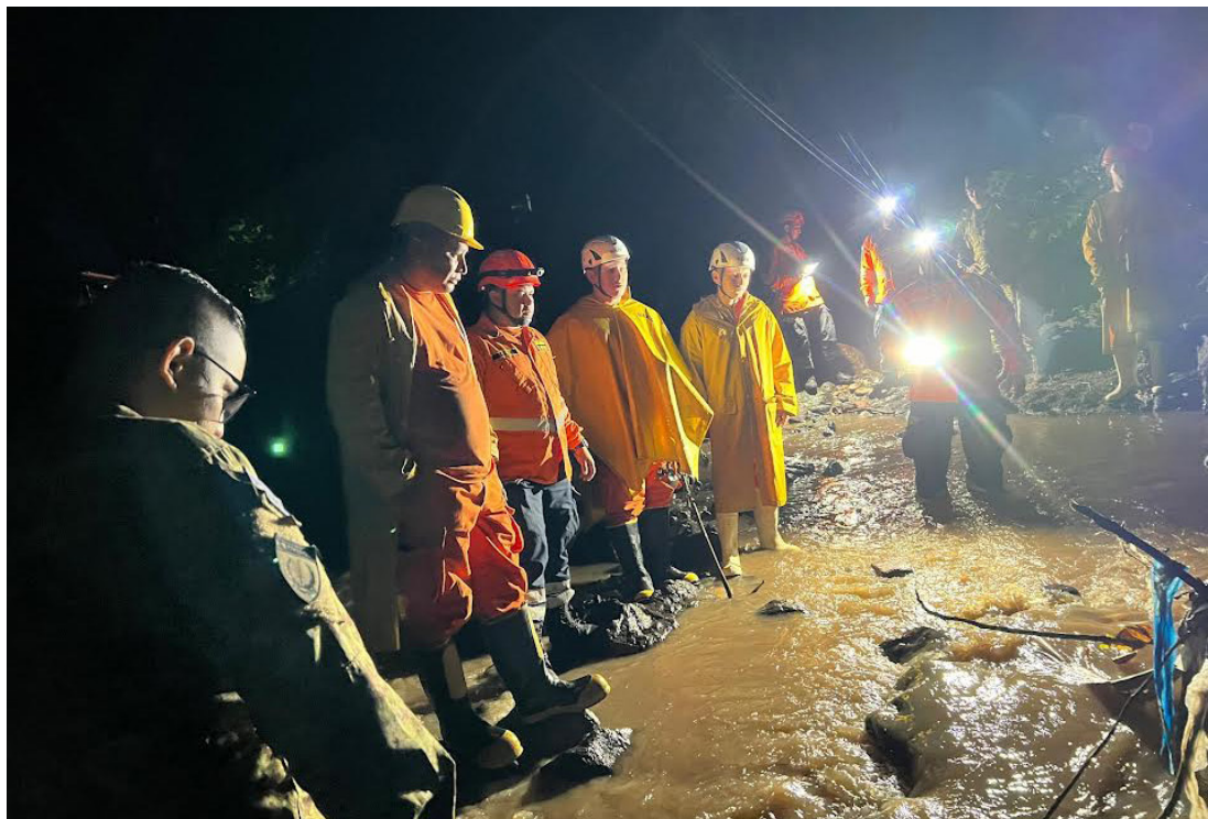
Una madre y su hijo fueron arrastrados por una correntada en la quebrada de la colonia Remaguiza, en San Vicente.