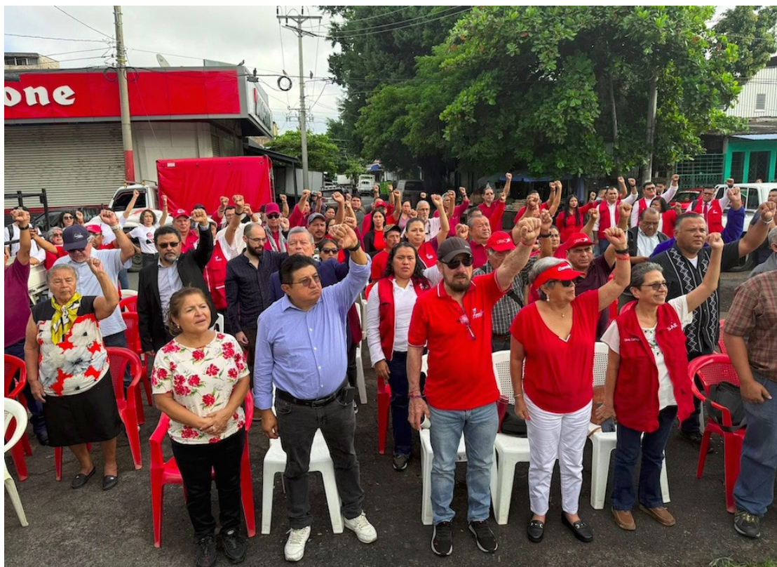
La militancia y la dirección nacional se hacen presentes en el Cementerio Los Ilustres para celebrar la vida de Hándal.