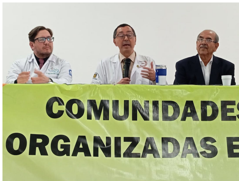
COFOA, SIMETRIS y el Colegio Médico piden que la nueva Red de Hospitales se estructure con base en las necesidades reales de los usuarios y el personal de salud.

“La falta de recursos económicos obliga y orienta a la gente a aglutinarse en el sistema de salud pública, pero, esto causa también un desabastecimiento o falta de medicamentos, para cubrir la necesidad y demanda que hay dentro del sistema de salud pública, lo que obliga al