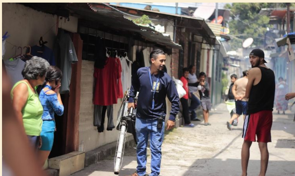
Las comunidades recibirán el título de propiedad a través del Fondo Social para la Vivienda (FSV).

El legislador, quien propuso la iniciativa la semana pasada, sostuvo que “los políticos anteriores llegaban