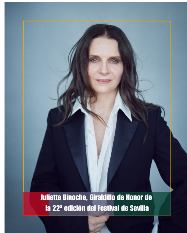
Juliette Binoche, Giraldillo de Honor de la 22ª edición del Festival de Sevilla