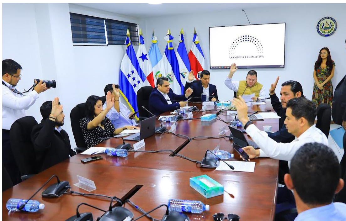
Comisión de Hacienda y Especial del Presupuesto de la Asamblea Legislativa dictamina a favor de asignar $113.2 millones a diversas instituciones del Estado.

El ramo de Educación, Ciencia y Tecnología se asignan $2.5 millones; “para continuar garantizando la articulación y provisión de servicios de atención integral para los niños y niñas en su primera