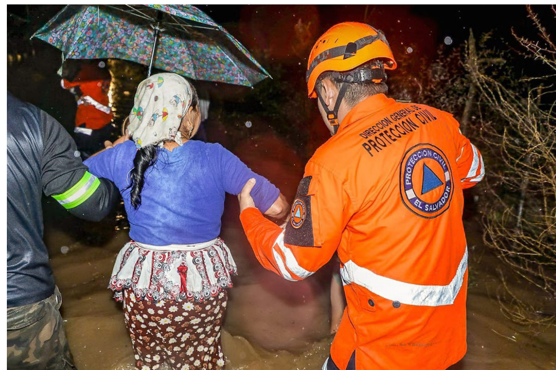
De manera preventiva una familia fue evacuada del cantón Sirama, departamento de La Unión, debido a las lluvias.