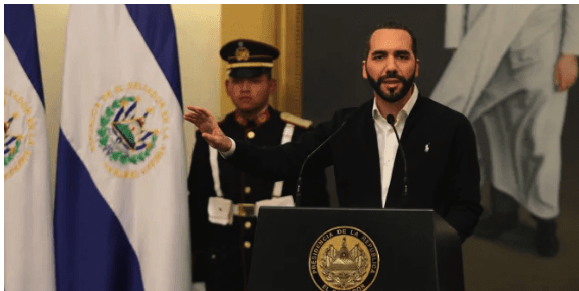
Nayib Bukele reacciona ante la decisión de la CIDH para estudiar a fondo la destitución de los magistrados de la Sala de lo Constitucional de la Corte Suprema de Justicia.

La noche del uno de mayo, los diputados de Nuevas Ideas, vía dispensa de trámite, destituyeron a los cinco magistrados de la Sala de lo Constitucional de la Corte Suprema de Justicia y al fiscal general de la República. La acción fue catalogada como un golpe de Estado al Órgano Judicial; hubo docenas de pronunciamientos en contra y condenando la acción ya que se trataba de un golpe a la democracia, a la institucionalidad, estado de derecho y la separación