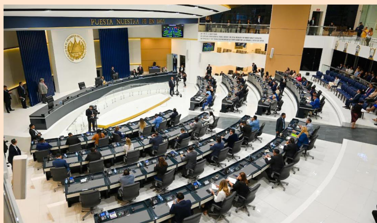
Asamblea aprobará los tres dictámenes de la Comisión de Hacienda este martes en la sesión plenaria.

Con el préstamo, presuntamente, se beneficiarían a 74,000