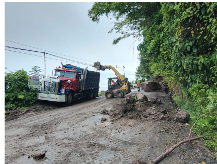
En el kilómetro 10 de la carretera a Panchimalco, un derrumbe afectó el paso vehicular.

Medio Ambiente recomendó a la población mantenerse informada sobre el pronóstico meteorológico, para tomar las medidas preventivas adecuadas, quienes desarrollan la navegación marítima y aérea, pesca artesanal o deportiva deberán evaluar las condiciones atmosféricas y oceanográficas antes de iniciar sus actividades.