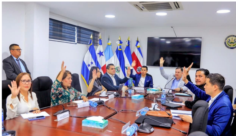
La Comisión de Hacienda citará a representantes de las instituciones públicas para que expliquen el presupuesto asignado para el próximo año.

El 14 de noviembre al Ministerio de Educación, Ciencia y Tecnología y Ministerio de Salud. El 21 de noviembre al Mi-