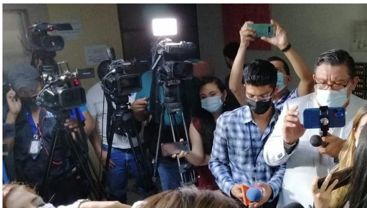
La APES registra el desplazamiento forzado de 43 periodistas, el 85% de casos de exilio ocurrió por el temor a una posible orden de captura.

La salida forzada de periodistas del país implica un fuerte riesgo de un apagón informativo, que ya ha dejado ver sus primeros signos, con una reducción del flujo informativo dentro de los medios digitales independientes, que desde meses atrás ya habían experimentado un primer obstáculo en su sostenibilidad debido al recorte o anulación de fondos de la cooperación de los Estados Unidos (USAID), hacia las organizaciones implementadoras que trabajaban con medios de comunicación.