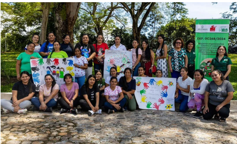
25 mujeres de ASMUPAZ participaron en una jornada de autocuidado orientada al bienestar físico, emocional y mental.

Estas iniciativas son posibles gracias al apoyo de Solidaridad Internacional Andalucía, con la financiación de la Agencia Andaluza de Cooperación Internacional para el Desarrollo.