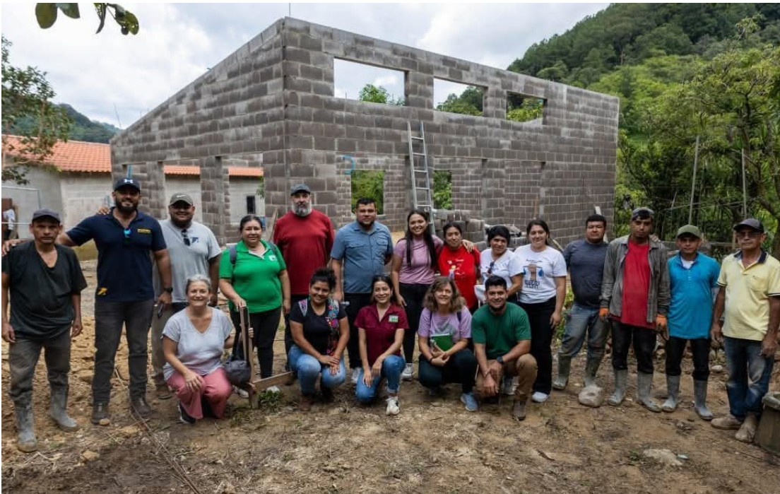
Una delegación de Solidaridad Internacional Andalucía visitó los cimientos de la nueva escuela agroecológica de Chalatenango.