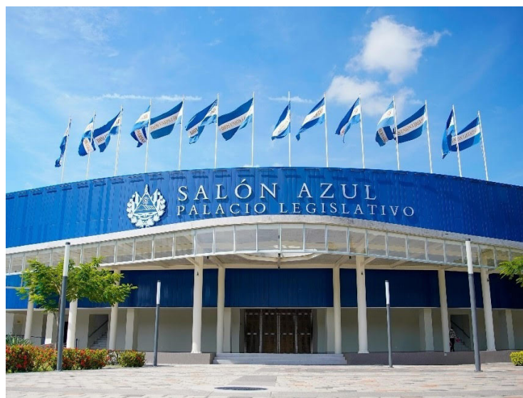
La Asamblea Legislativa ha aprobado casi dos mil millones de dólares en préstamos en 2025.