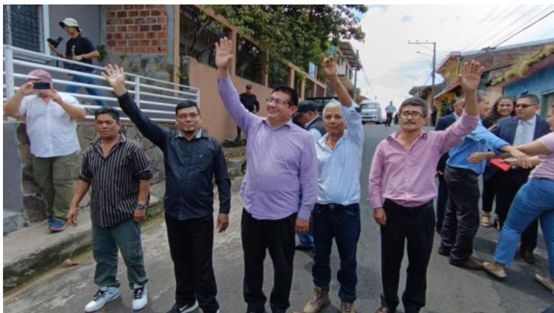
Las organizaciones sociales piden a la FGR no apelar el fallo, a favor de los cinco ambientalistas de la comunidad Santa Marta, Cabañas.

Comunidad Santa Marta vuelven a alzar la voz por la libertad de las personas inocentes, pero también porque se detengan las intenciones de reactivar la minería metálica.