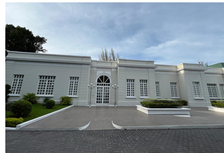
La Presidencia de la República tendrá el cuarto refuerzo presupuestario en el año 2025.

Estos montos totalizan $113,200,000; “con cargo al Fondo General, y que pueden reo-