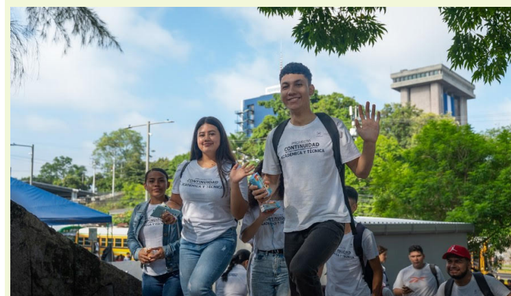
La Dirección de Integración en convenio con el Ministerio de Seguridad ejecutará el programa enfocado en jóvenes en riesgo.

El programa se ejecutará por la Dirección de Integración por medio de un convenio de cooperación con el Ministerio de Seguridad, suscrito el 27 de junio de este año. Esto permitirá atender actividades “integradoras” dirigidas a jóvenes participantes de distintos distritos del departamento de San Salvador, que incluyen servicios profesionales en medicina general y programas de formación técnica para el trabajo; cursos laborales-vocacionales en las áreas de panadería, electricidad, fontanería, elaboración de productos artesanales; así como, la contratación de consultores técnicos y administrativos para la gestión del Programa.