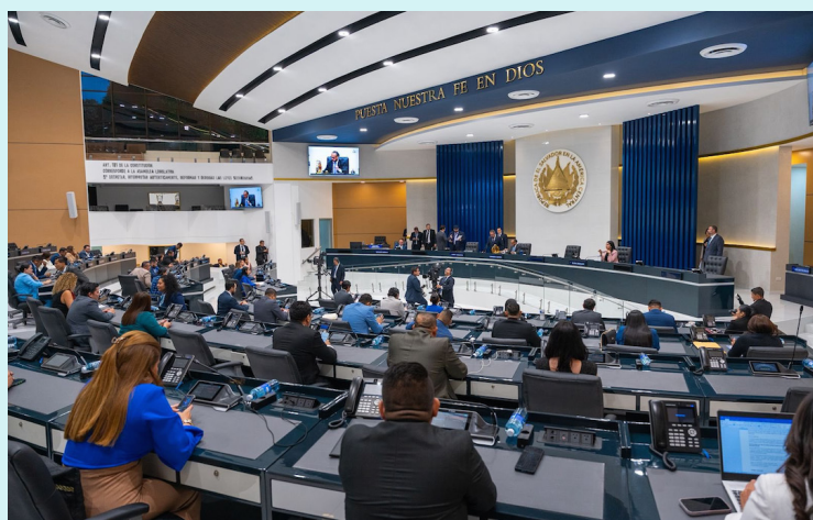
La junta directiva de la Asamblea Legislativa ha propuesto un presupuesto de $46.9 millones para la institución para el próximo año.

La junta directiva de la Asamblea Legislativa ha propuesto $46.9 millones para el presupuesto 2026 del Órgano Legislativo, misma cifra del Presupuesto 2025. Esta propuesta fue consultada con el presidente de la República, Nayib Bukele, “para asegurar la disponibilidad de los fondos necesarios para su ejecución”, según lo dispone la Cn.