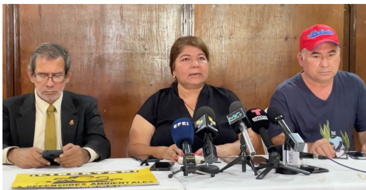
El movimiento popular externa la preocupación por los casos de persecución y criminalización de defensores de derechos humanos.