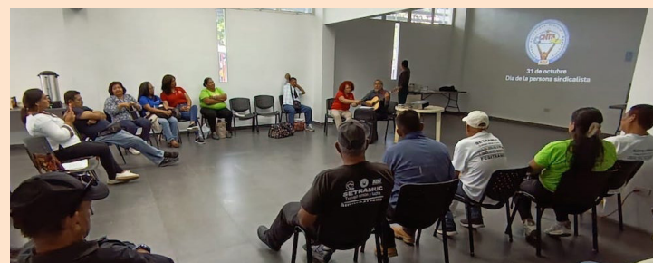
La CNTS conmemoró este 31 de octubre el día del sindicalista salvadoreño, en medio de represión y amenaza, pues el gobierno continúa con la política antisindical.

bierno de Nayib Bukele a respetar la libertad sindical y el derecho de asociación que han costado la sangre de mártires de la clase trabajadora como los sindicalistas de FENASTRAS y otras dirigencias que a lo largo de años han ofrendado sus vidas y fueron consecuente con los intereses de la clase trabajadora, incluso, en el peor momento de la lucha por la liberación de El Salvador.