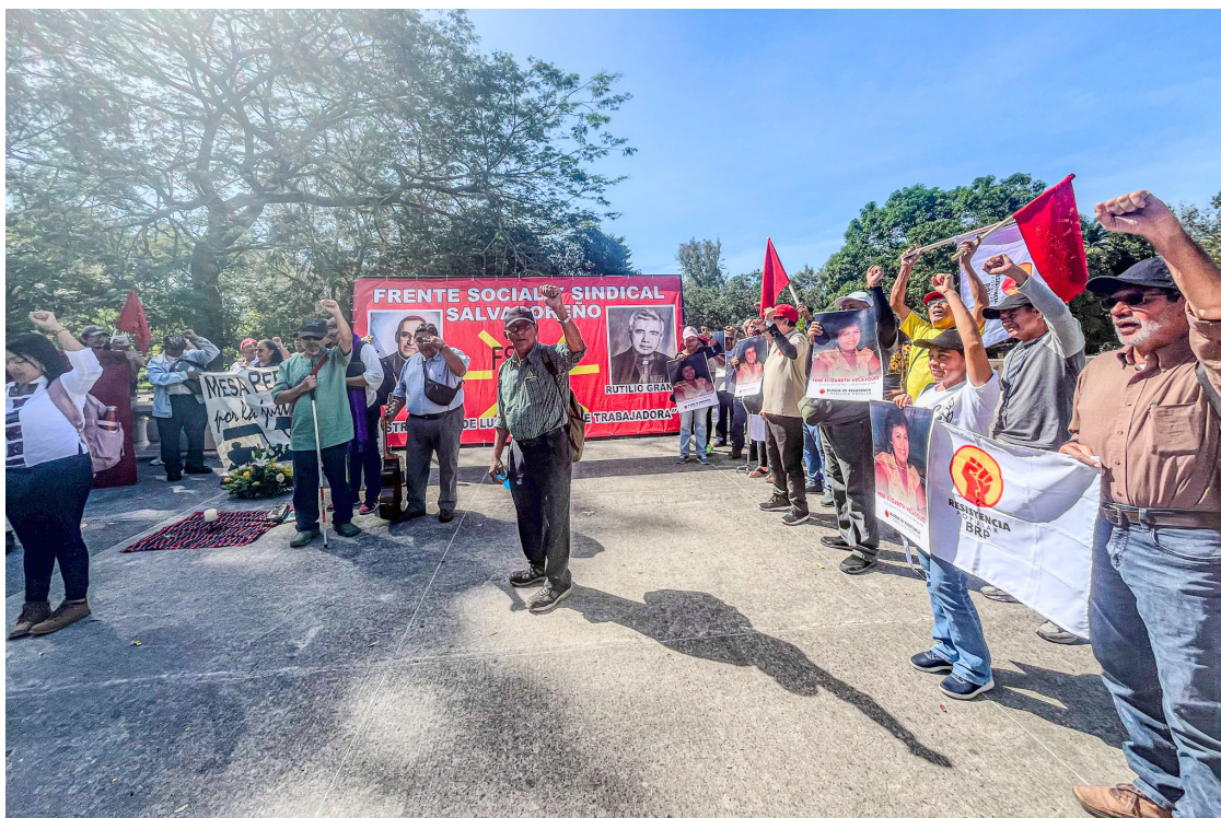
Redacción Nacionales @DiarioCoLatino

El Bloque de Resistencia y Rebeldía Popular (BRP) y la Mesa Permanente por la Justicia Laboral conmemoraron este 31 de octubre el Día de la Persona Sindicalista, por lo que demandaron del Gobierno el respeto de los derechos humanos y laborales. Además, informaron que desde 2019 se han despedido a 40 mil empleados y se han desarticulado más de 60 sindicatos.