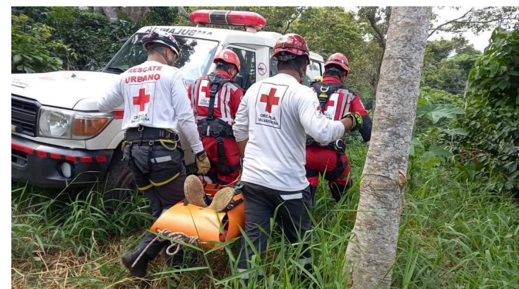
La Cruz Roja Salvadoreña está conformada por cuatro cuerpos filiales: Cruz Roja de la Juventud, Comité de Damas Voluntarias, Cuerpo de Guardavidas Voluntarios y Cuerpo de Voluntarios Socorristas.

Unidad Motorizada (UM): brinda asistencia inmediata en el lugar del incidente, antes de la llegada de las ambulancias.