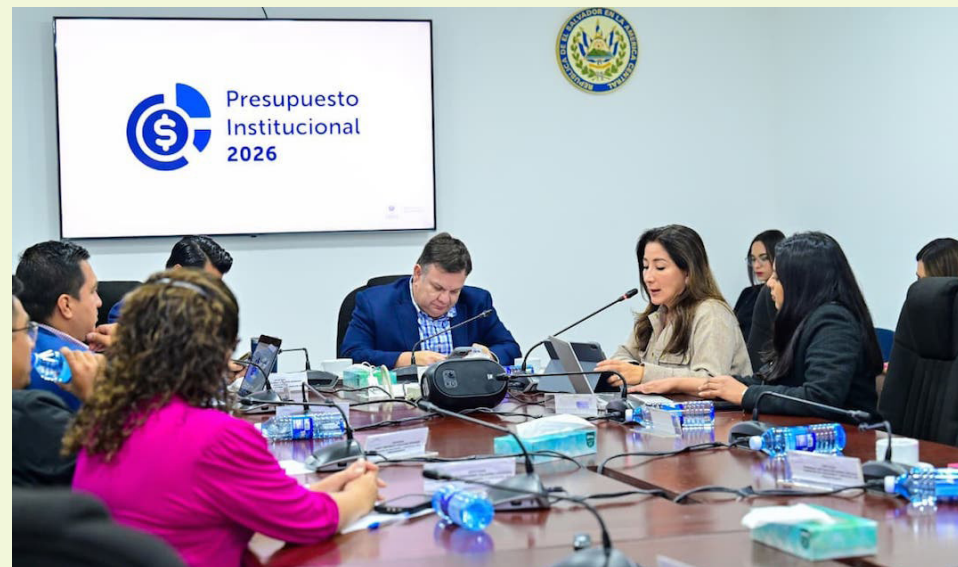
El Ministerio de Vivienda tendrá un presupuesto de $13.6 millones para el próximo, del cual, $8 millones son para inversión pública.