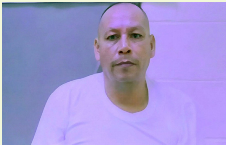
El fallo fue emitido por el Juzgado Especializado de Sentencia LEIV de San Salvador.

De acuerdo con la confesión presentada ante la jueza, el 9 de octubre de 2023, la víctima de 7 años, pasaba frente a la vivienda del procesado, quien la llamó e hizo ingresar. Una vez dentro, la asfixió mientras estaba sentada en un sofá y posteriormente la agredió sexual-