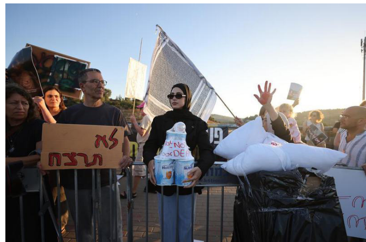
Imagen del 29 de agosto de 2025 de personas participando en una manifestación para protestar contra la hambruna provocada por la operación del Ejército israelí en la Franja de Gaza, en Jerusalén.

De acuerdo con las FDI, sus fuerzas blindadas dieron muerte