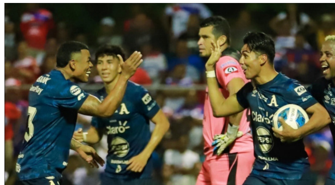
Jugadores de la Alianza celebran el triunfo contra Luis Angel Firpo.