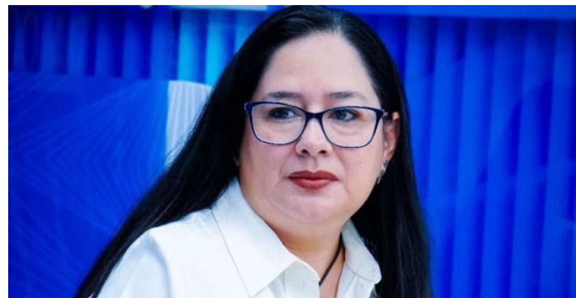
Ruth López ha recibido reconocimiento internacional. En 2024, la BBC la incluyó entre las 100 mujeres más influyentes del mundo.