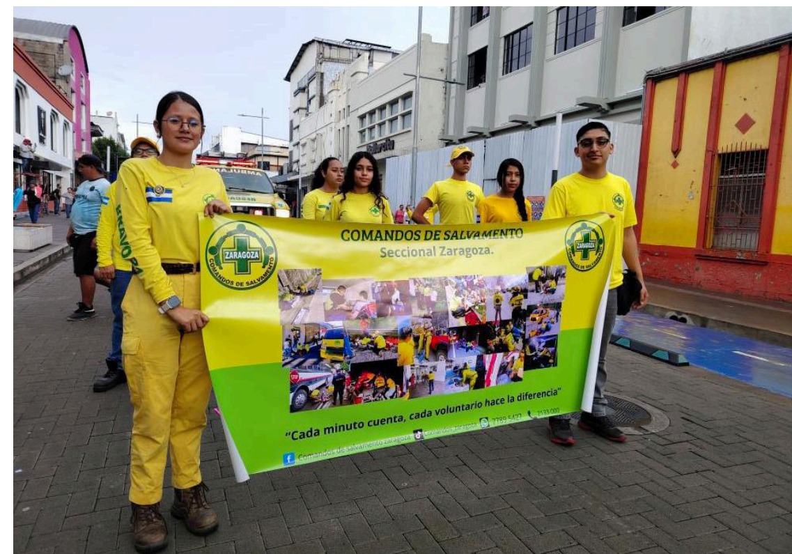
Comandos de Salvamento nació el 30 de septiembre de 1960 en Ciudad Delgado.