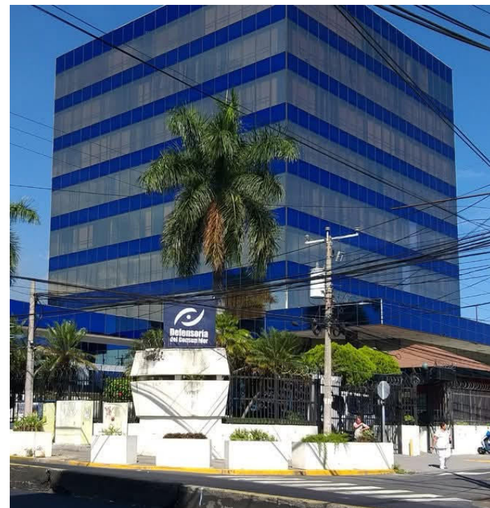
Las remesas familiares no están sujetas a impuestos en El Salvador, y la Ley contra el Lavado de Dinero solo regula los reportes de transacciones inusuales aseguran especialistas.

De acuerdo con especialistas en materia financiera, las remesas familiares no están sujetas a impuestos en El Salvador, y la Ley contra el Lavado de Dinero solo regula los reportes de transacciones inusuales, sin establecer retenciones. La denuncia abre interrogantes sobre los criterios aplicados por los bancos al clasificar a sus clientes como “agentes extranjeros”, lo que podría derivar en un caso de cobros indebidos que afecta directamente a la población que depende de las remesas, principal fuente de ingresos de más de un tercio de los hogares salvadoreños.