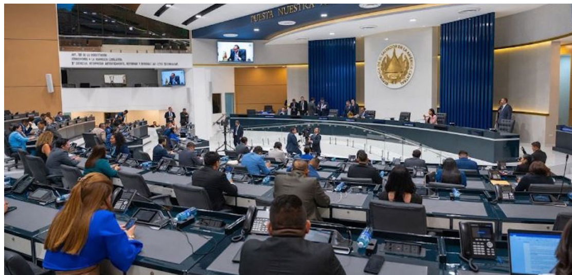
Asamblea Legislativa asigna $250 millones al Presupuesto de Hacienda pero sin mencionar los destinos.

Claudia Ortiz, votó en contra de este dictamen de la Comisión de Hacienda ya que señaló que no se especifica en qué se usará el dinero. “El decreto no establece un detalle de a qué partidas específicas se van asignar estos $250 millones, solo menciona una unidad presupuesta-