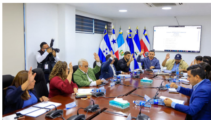
Momento en que la Comisión de Infraestructura vota a favor de reformar la ley para beneficiar a pobladores del Caserío La Concordia en Jiquilisco, Usulután.

“Al final termina siendo gasto corriente, que es lo que ellos habían prometido que no se iba a hacer en este año, porque el presupuesto venía totalmente financiado, entonces ahí vemos que ha sido al final un engaño para la gente”, concluyó la legisladora.