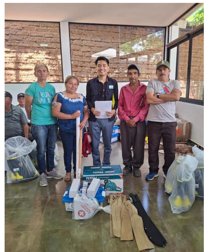
PROVIDA ejecuta proyectos que buscan fortalecer las respuestas de las comunidades frente incendios forestales.

Con el proyecto de prevención y respuesta ante incendios, PROVIDA y sus aliados internacionales refuerzan la tradición de trabajo solidario y comunitario en Suchitoto, adaptándola a los desafíos ambientales que enfrenta el territorio.