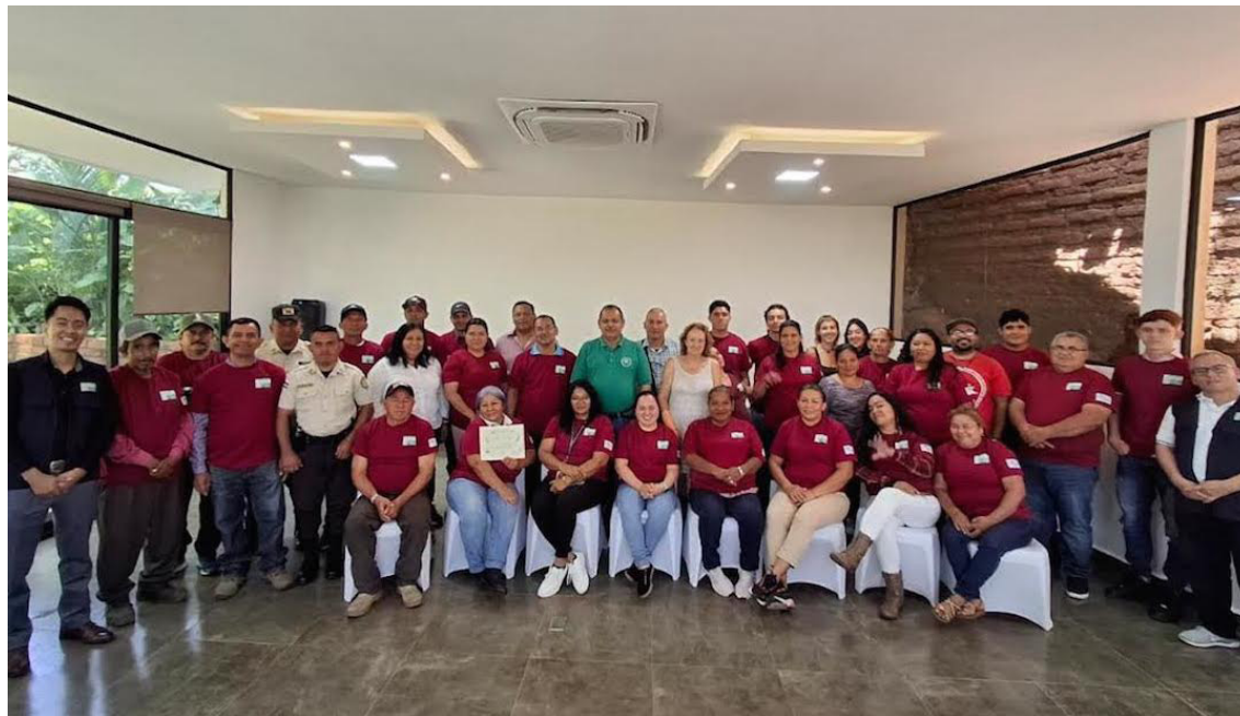
Comunidades de Suchitoto fueron fortalecidas con equipo especializado en control de incendios forestales y primeros auxilios.

Uno de los momentos más destacados fue la entrega de equipo especializado, que incluyó herramientas manuales, dispositivos electrónicos, insumos digitales