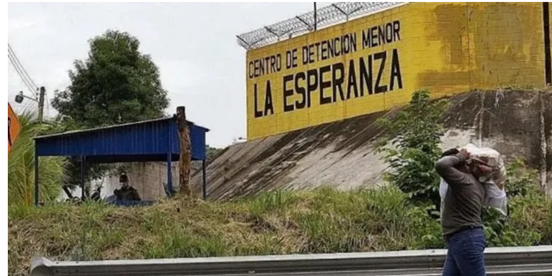
Congresistas de EUA demócratas han pedido a su Gobierno que le pida un informe al Gobierno de El Salvador, un informe sobre los derechos humanos en las cárceles en El Salvador.

Los congresistas señalan en la misiva que las condiciones carcelarias en El Salvador representan no solo “la crueldad” que amenaza la dignidad humana, sino también “graves violaciones” por parte de El Salvador de sus obligaciones en virtud del de-