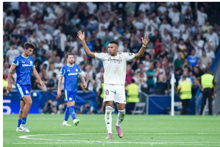
Kylian Mbappé, de Real Madrid, festejando su anotación durante el partido de la primera ronda de la Liga de Campeones de la UEFA, entre Real Madrid y Olympique Marseille, en Madrid, España.

La sorpresa de la jornada fue la victoria del modesto equipo Qarabag contra el Benfica 3-2. Una fecha en la que a golpe de goles, Borussia