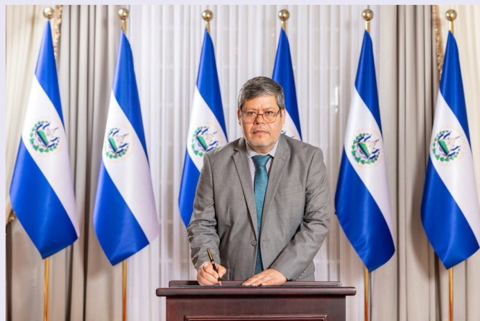
Según Presidencia, el nuevo titular es licenciado en Física y máster en Geología, con formación en hidrología, tratamiento de aguas, desalinización y eficiencia en riego.

Desde 2019, se han destituido al menos 4 titulares. El primero fue Frederick Benítez, quien estuvo en ANDA un año y enfren-