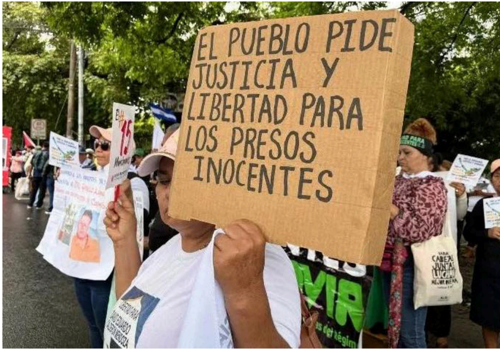
WOLA destacó que MOVIR defiende valientemente los valores democráticos en un entorno cada vez más represivo.