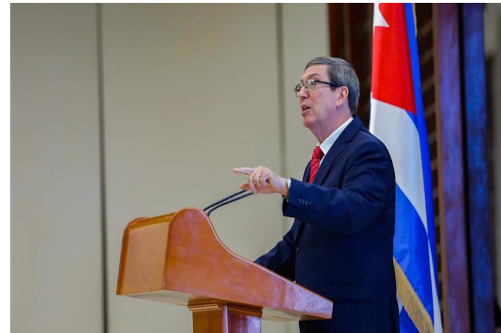
Bruno Rodríguez, ministro cubano de Relaciones Exteriores.

El ministro ratificó que su gobierno defiende la proclama de América Latina y el Caribe como Zona de Paz y llamó a la comunidad internacional a movilizarse por el derecho internacional y los principios de la carta de Naciones Unidas para preservar la